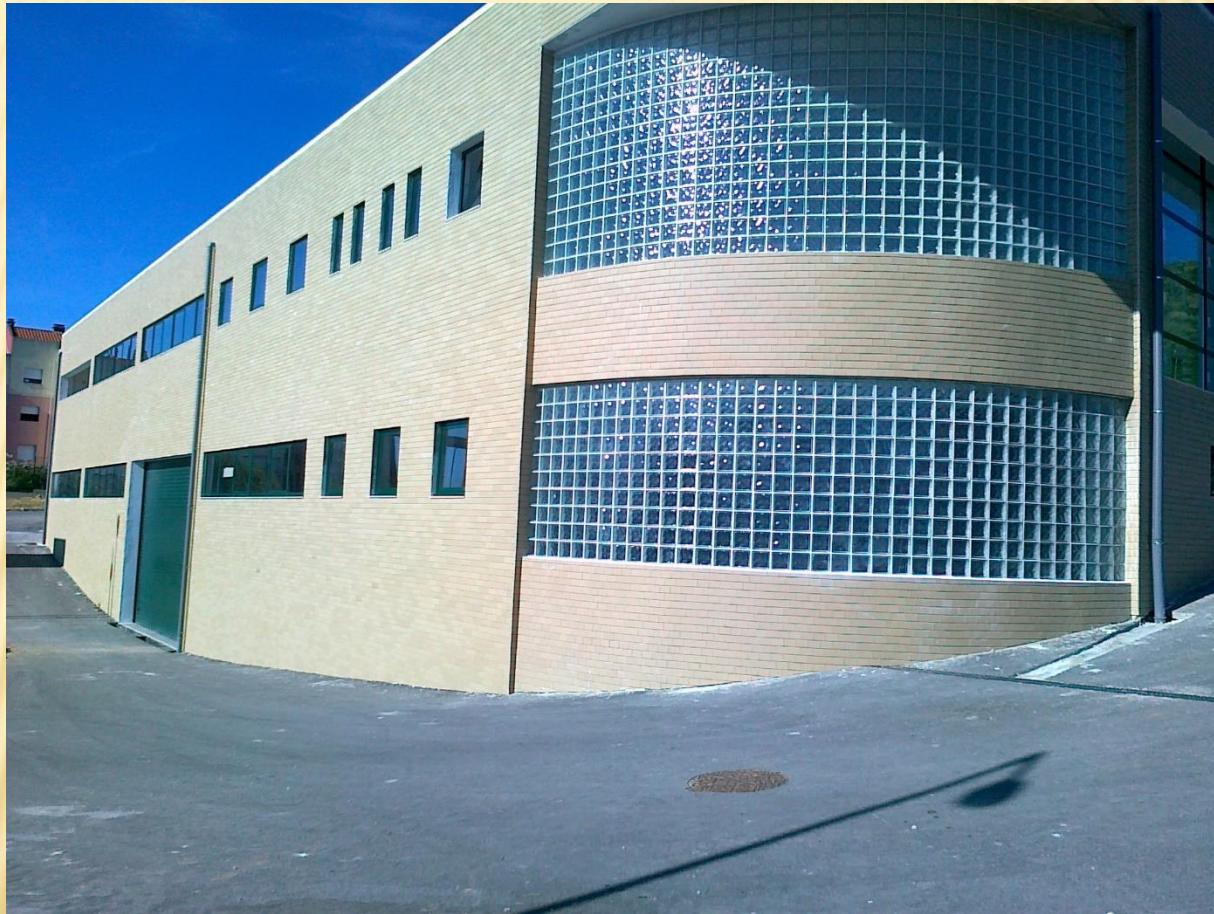
✕ FACHADA FRONTAL