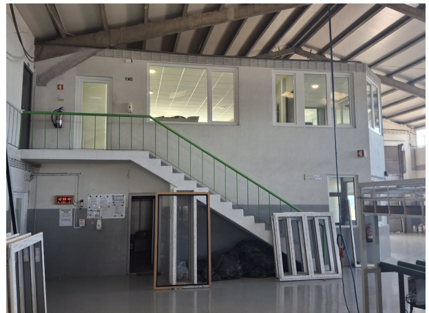
Armazém Industrial Abrunheira, Rua das Maçarocas 1, Sintra, Abrunheira, 2710-056