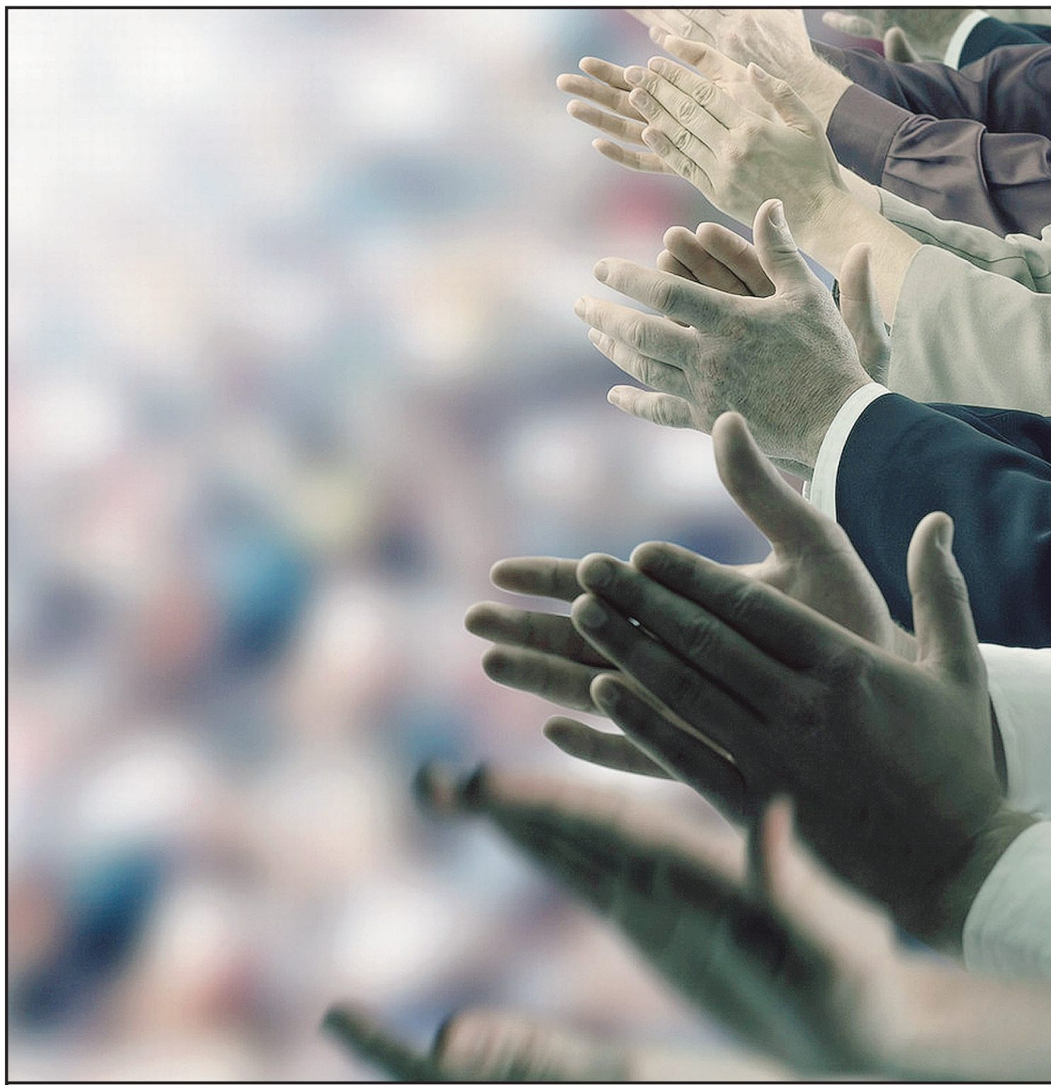
VOX POPULI L'applauso, l'espressione più classica e popolare del gradimento. Anche per la politica e per chi ne incarna gli ideali

In tali condizioni la denuncia del «populismo» mira fin troppo a disarmare la protesta sociale, in seno a una destra attenta specie agli interessi e a una sinistra massicciamente conservatrice e isolata dal popolo. La denuncia permette alla Nuova Classe, venale e corrotta, ansiosa - dice Annie Collovald - di «delegittimare chi nel popolo vede la causa da difendere e di favorire chi nel popolo vede il problema da risolvere», di sdegnare il popolo. Ricorrervi è denunciato come una patologia politica, quasi come una minaccia per la democrazia. Dimenticando che in democrazia il popolo è l'unico depositario della sovranità. Specie quando essa è confiscata.