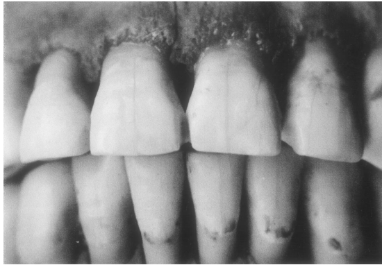
Fig. 3 – Vue de face du bloc incisif supérieur et inférieur.

Un examen attentif du groupe incisif supérieur fait apparaître une anomalie de forme aux trois points de contacts interdentaires (fig. 3). Sans aucun retentissement pathologique, ces pertes de substances sont en forme de coin, de dimensions constantes pour les incisives centrales. La dentine est mise à nu. Les pertes sont symétriques de part et d'autre des dents en contact. Les deux encoches externes créées sont les plus importantes, celle de droite étant la plus profonde. Cette remarque associée à la légère hypertrophie des os du membre supérieur gauche du squelette pourraient indiquer que de son vivant, cette femme était à prédominance gauchère. Ces manques de substances sont la réponse des organes dentaires à leur utilisation quotidienne et répétée au cours d'une vie dédiée à une activité professionnelle spécialisée.