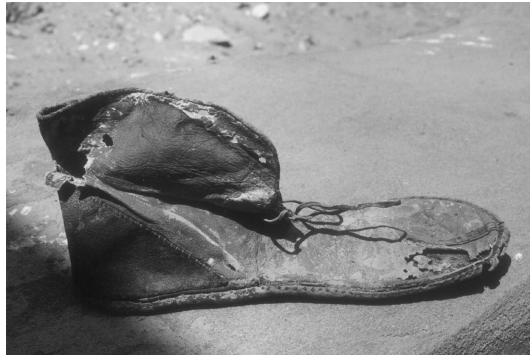
Fig. 4 – Vue de la chaussure droite au moment de sa découverte

Ces chaussures, remarquables exemples du travail du cuir, ne correspondent en rien aux sandales que portait l'Égyptien ancien. En effet, si l'on s'en tient aux scènes de la vie quotidienne, l'Égyptien vivait pieds nus. Signe d'apparat, il ne portait des chaussures en cuir que pour assister aux cérémonies religieuses ou funéraires. Pourtant à la XX e dynastie, il semble exister un modèle appelé fnw , "chaussures montantes en cuir". Une telle paire destinée plus particulièrement aux femmes et aux enfants coûtait deux deben.