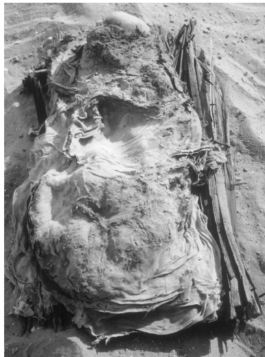
Fig. 1– La momie au moment de sa découverte.

Lors du dégagement de la face ouest de la pyramide de Pépy I er , roi de la VI e dynastie, une fosse, qui contenait une femme enveloppée dans un linceul en lin, a été mise au jour sur le sommet du premier gradin de la construction, exactement à 6,30 mètres de hauteur (fig. 1).