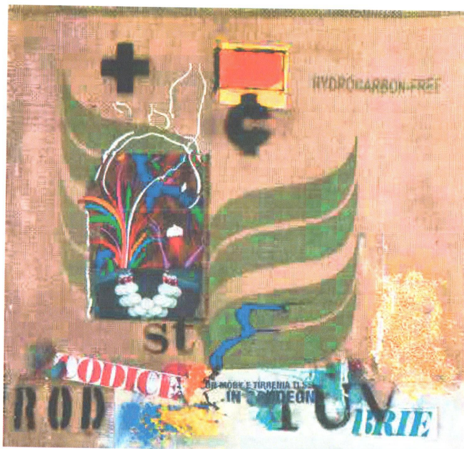
Brie tecnica mista, collage, sacco su tela 52 x 50 cm