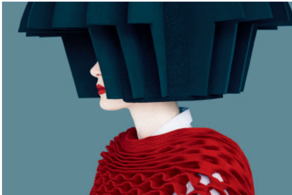
Junya Watanabe (Honeycomb), Old Future, 2015/2018, Chromogenic Print Blattgröße 116,8 x 175,3 cm, Auflage 9 plus 2 AP