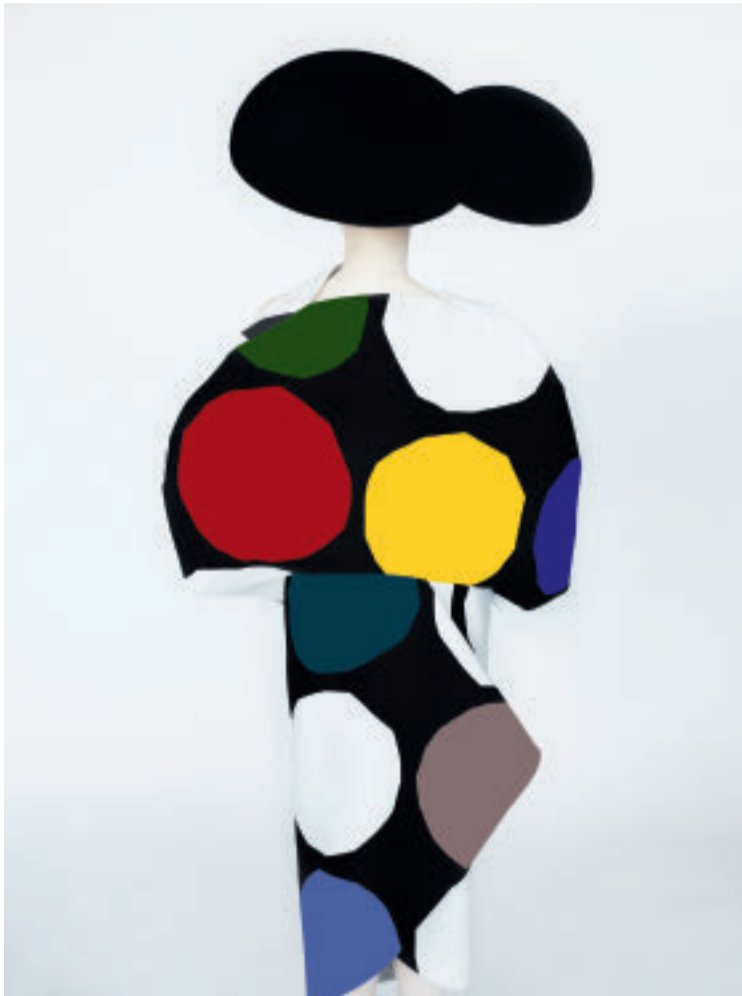
Junya Watanabe, 2018/2018, Chromogenic print Blattgröße 304.2 x 182.2 cm, Unikat