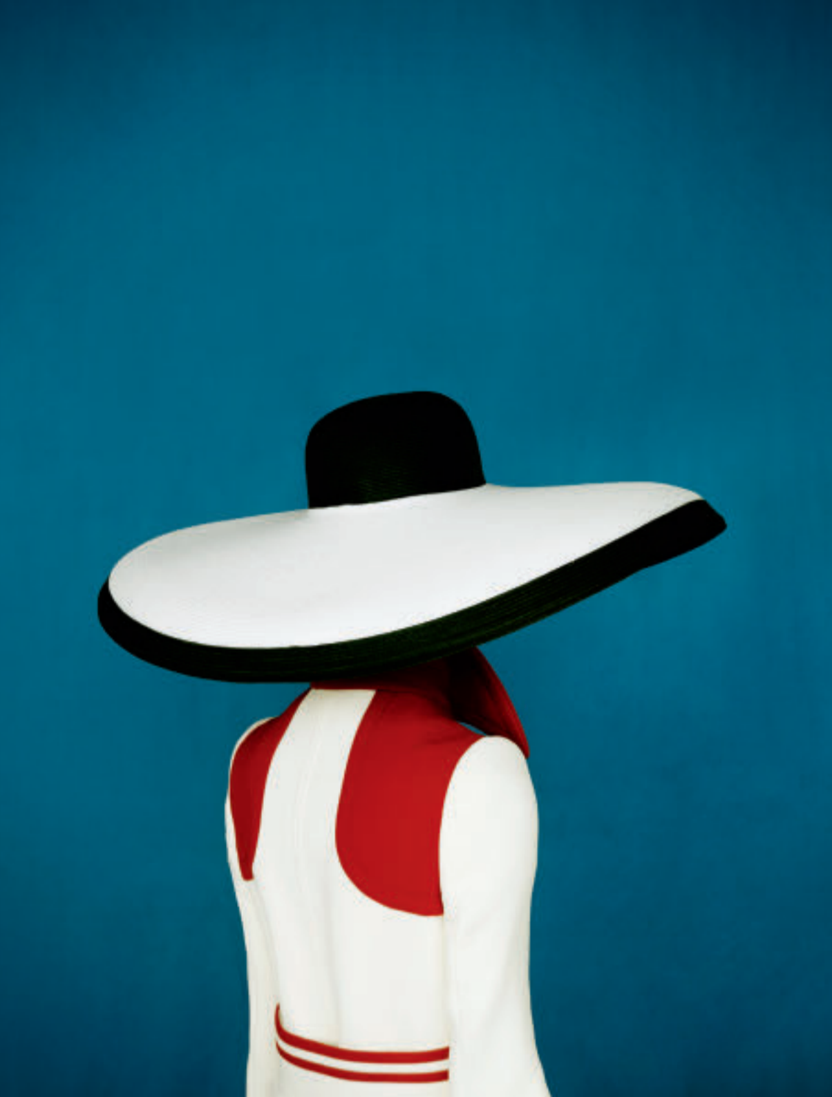
Muse, Old Future, 2014/2018, Chromogenic print, Blattgröße 101.6 x 76.2 cm, Auflage 9 plus 2 AP