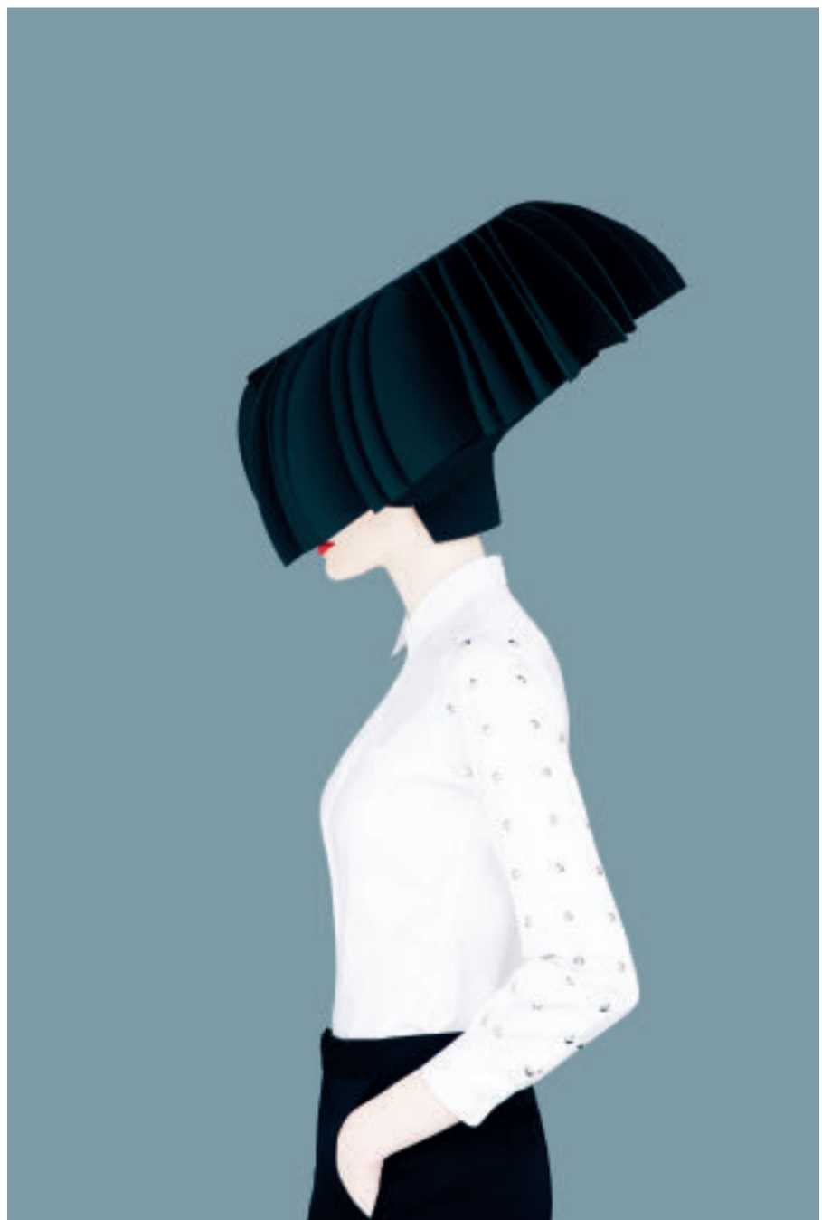
Junya Watanabe (Honeycomb), Old Future, 2015/2018, Chromogenic Print Blattgröße 182,9 x 116,8 cm, Auflage 9 plus 2 AP

„Old Future“ lautet der Titel von Erik Madigan Hecks aktueller Monographie und der Titel ist durchaus programmatisch zu verstehen. Seine Modefotografien sind auf verblüffende Weise altmodisch und modern zugleich. Zeitlos elegant und im Kontrast zu der seit Jahren vermittelten Trashkultur verführerisch schön.