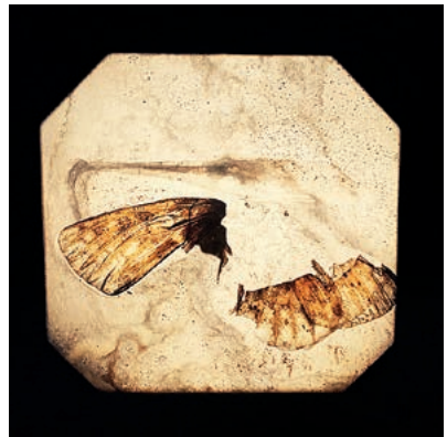
Brigitte Lustenberger · Bugs unknown XXI, 2017, C-print, Blatt 18 x 18 cm, beide Bilder: Courtesy Christophe Guye Galerie

→ Christophe Guye Galerie, bis 20.1. ↗ www.christopheguye.com