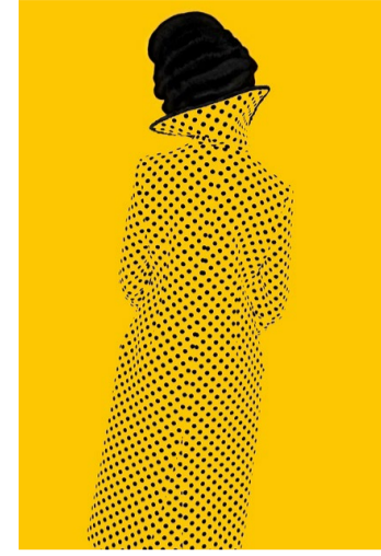
◀ «Without a Face (Yellow)», 2013, C-Print, Ed. 4/9, 16 500 Franken.