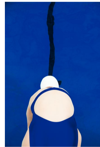
◀ «Katie Ledecy», 2016, C-Print, Ed. 5/9, 7 200 Franken.