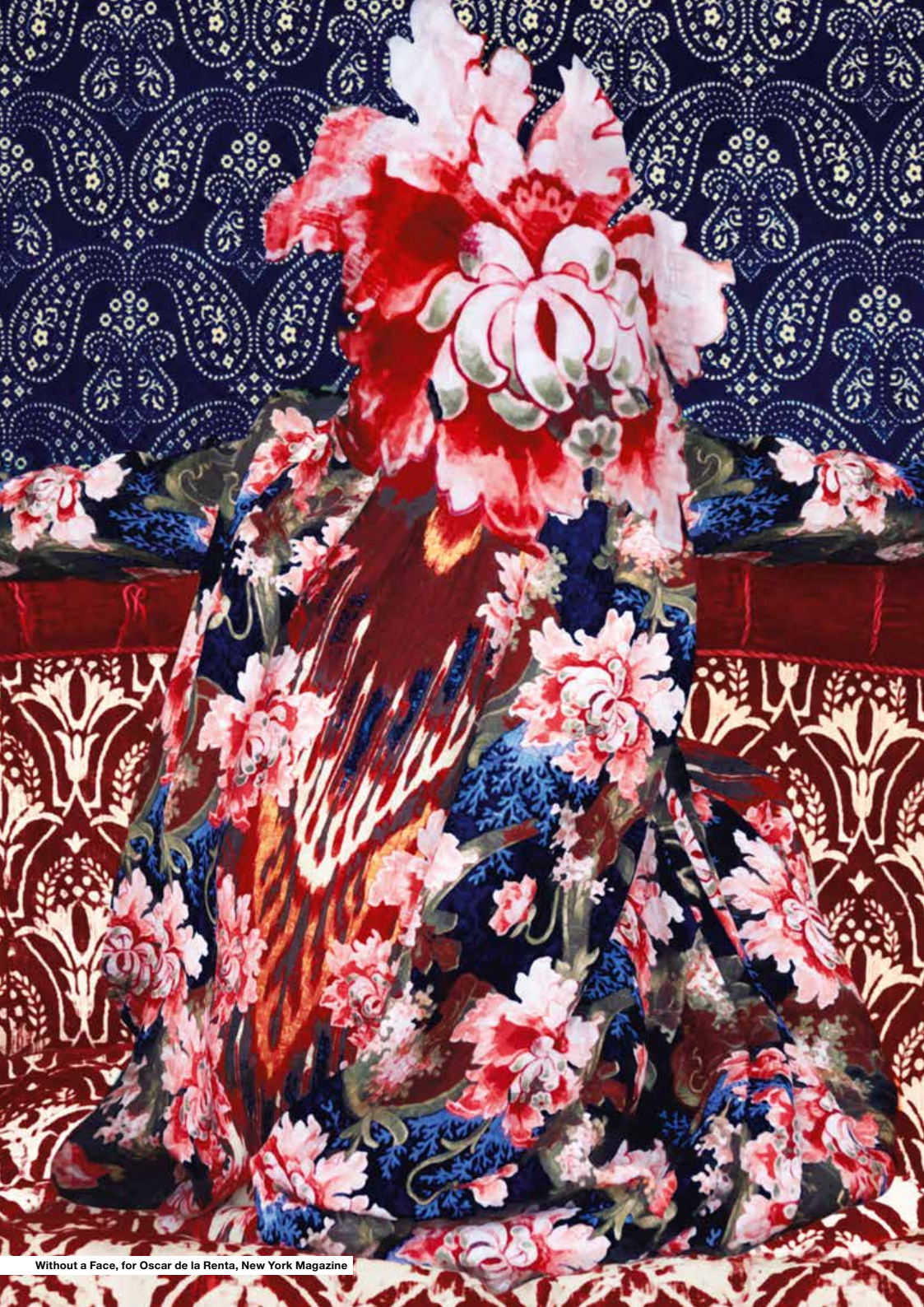
Without a Face, for Oscar de la Renta, New York Magazine