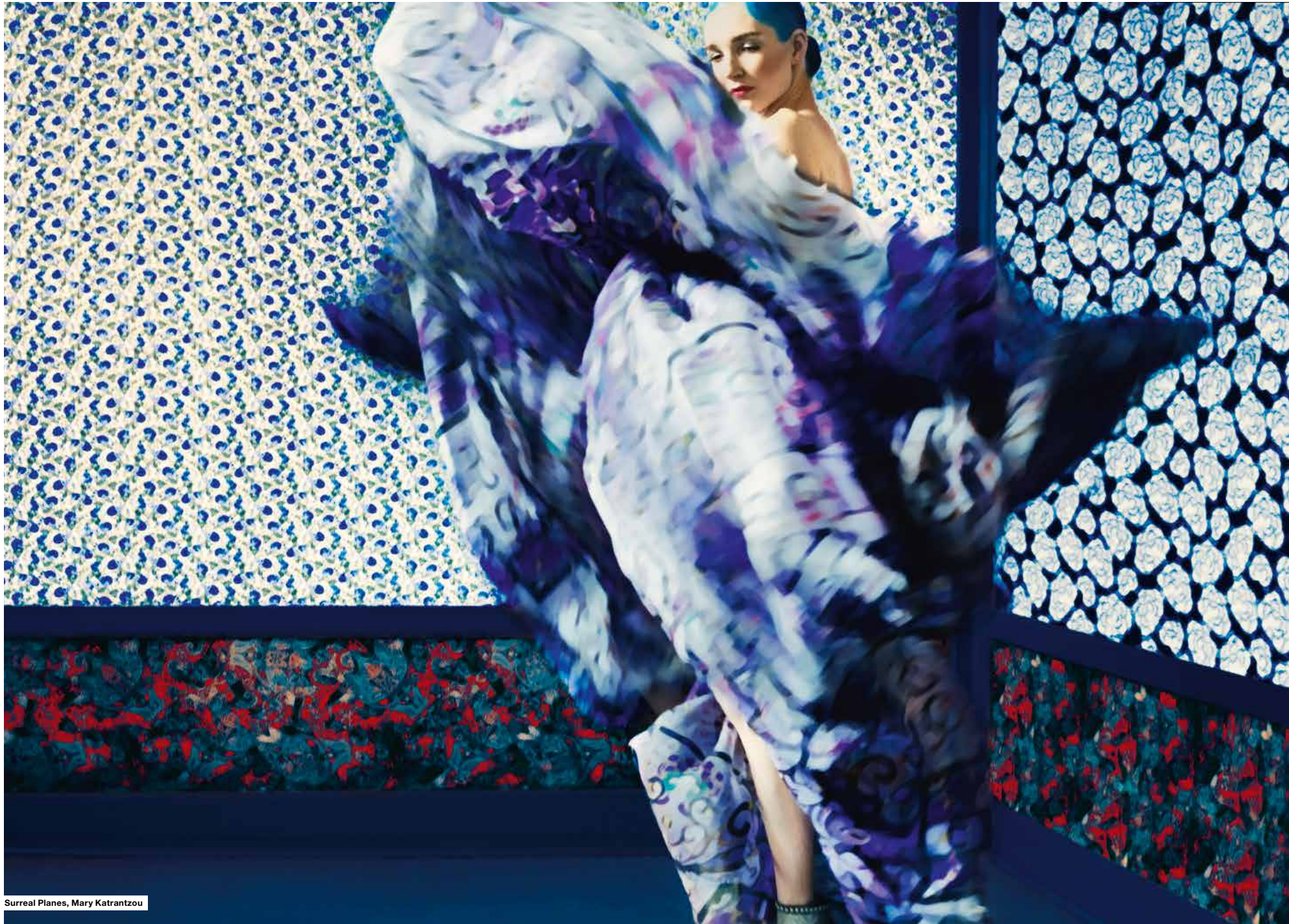
Surreal Planes, Mary Katrantzou