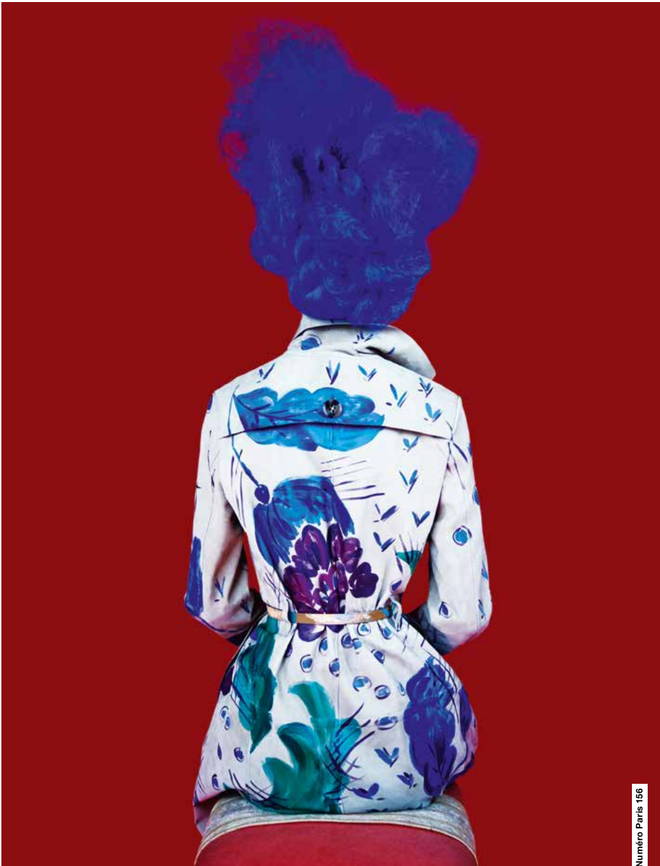
Numéro Paris 196