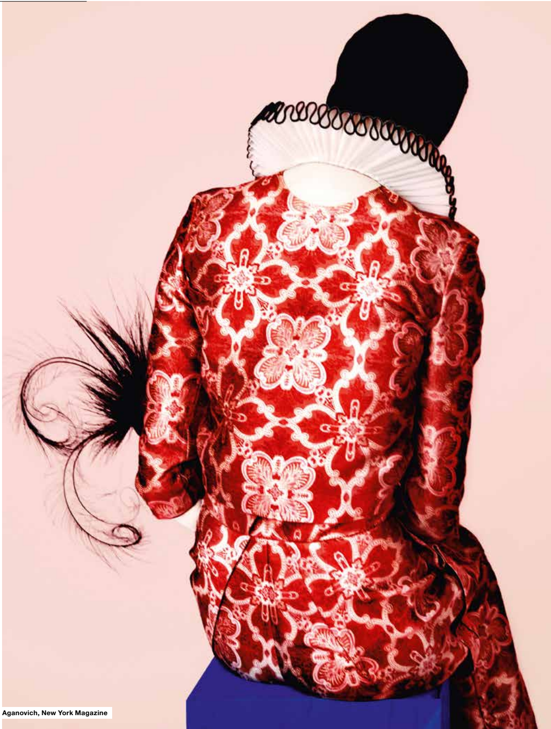
Aganovich, New York Magazine