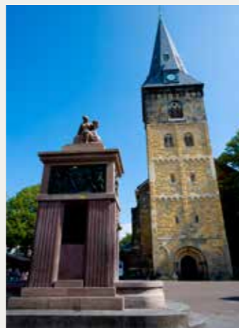
BRANDMONUMENT EN GROTE KERK

De toren van de GROTE KERK (NH) heeft een schitterende Romaanse ingangspartij. De eerste vier geledingen van de toren en de hoofdingang zijn van omstreeks 1200. Het materiaal is van Bentheimer zandsteen. In de zuidmuur is een zonnewijzer aangebracht door Coenraad ter Kuile in 1836. De E-lus geeft een vermelding van de maanden. Het is de oudste E-lus aan een openbaar gebouw in Nederland. Tegenwoordig wordt de kerk gebruikt voor concerten, tentoonstellingen, congressen, ontvangsten en huwelijks-voltrekkingen. In de zomermaanden is de kerk ook van binnen te bezichtigen.