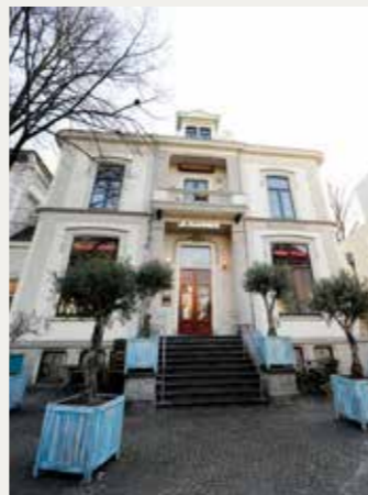
HET HUIS MET DE STOEP

'HET HUIS MET DE STOEP' , voormalige fabrikantenvilla van Van Heek , die een toonaangevende rol heeft vervuld in de textielindustrie. In de volksmond werd gesuggereerd dat de hoge stoep voor de villa is aangelegd om op de arbeiders te kunnen neerkijken. Tegenwoordig is er een restaurant gevestigd.