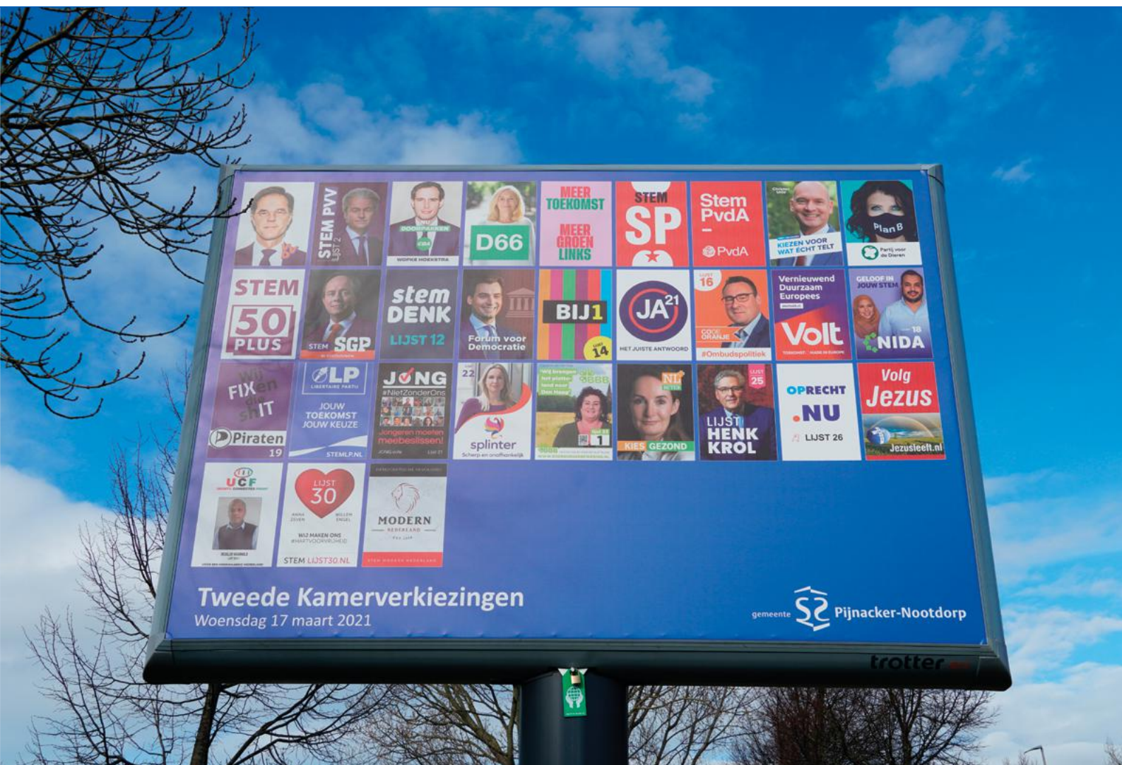
Opvallend, maar niet verrassend, is dat bijna alle verkiezingsprogramma's dit jaar veiligheid op een bepaalde manier in verband brengen met de volksgezondheid. Afgebeeld staat een billboard in Pijnacker

het meest bedreigt”. Ook het verkiezingsprogramma van FvD , waarin veiligheid onderdeel uitmaakt van het hoofdstuk over ‘Immigratie & Identiteit’, verwijst vooral naar veiligheidskwesties binnen onze landsgrenzen.