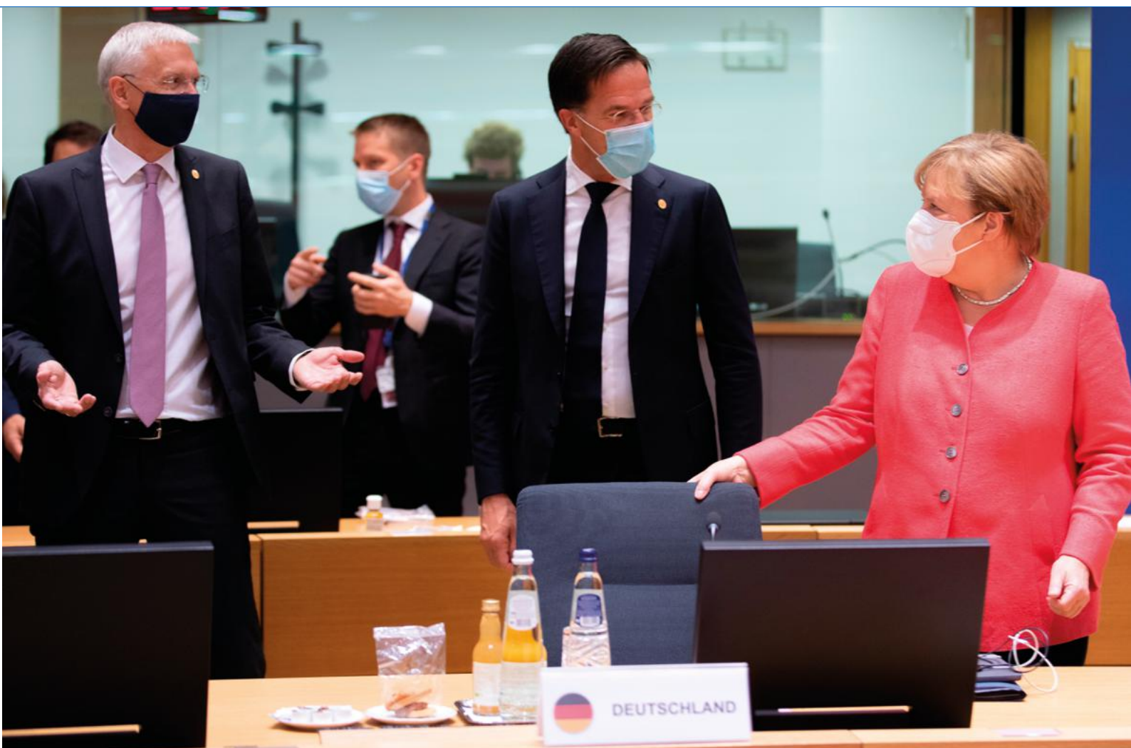
In de afgelopen jaren is het Nederlandse veiligheid- en defensiebeleid onmiskenbaar opgeschoven van het primaat voor de trans-Atlantische band met de Verenigde Staten naar meer inzet op Europese defensiesamenwerking. Afgebeeld staan demissionair premier Mark Rutte en de Duitse bondskanselier Angela Merkel bij een bijeenkomst van de Europese Unie (2020)

SP, CDA en VVD verwijzen expliciet naar de toenemende digitale dreiging vanuit landen als China en Rusland. D66 en PVV doen dat in meer algemene zin.