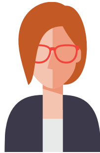
MARKEDSBESKYTTER Ivaretar Dagens org