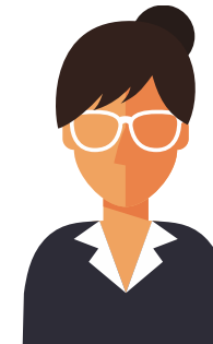
SAMSKAPER Sikrer endring i sitt team og på tvers