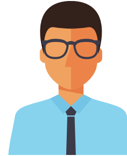
FORNYER Vitalitet – hele org