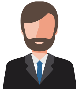
FASILITATOR Sikrer endring i sitt team