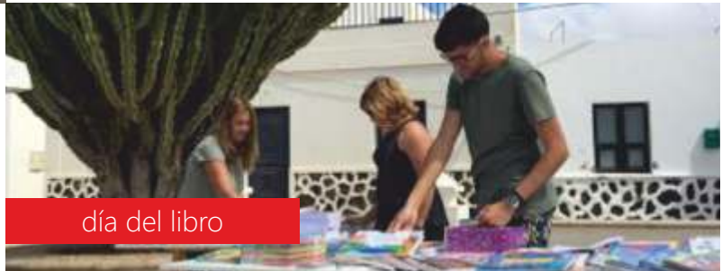
día del libro

La Graciosa vivió la celebración del Día Internacional del Libro , impulsando la lectura a través del intercambio y la venta de libros, con un puesto ubicado durante la mañana del 23 de abril en una de sus principales plazas, actividad que se completó un amplio programa diseñado por el Ayuntamiento de Tegüise, en el que hubo lugar para la lectura de relatos, cuenta cuentos en la calle, teatro, fotografía, poesía, concursos y talleres que se desarrollaron en la red de Bibliotecas municipales del municipio. La presentación del libro "Porque me lo pides tú", quedó suspendida hasta nueva fecha.