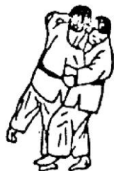
O SOTO GARI