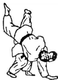
SOTO MAKIKOMI (avvolgimento esterno)