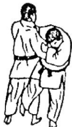
O SOTO OTOSHI