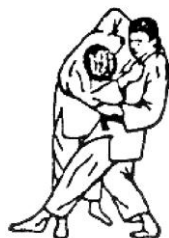
TANI OTOSHI (caduta nella valle)