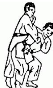
TSURIKOMI GOSHI (colpo d'anca tirando e sollevando)