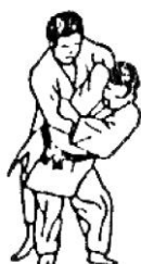
O GOSHI (grande anca)