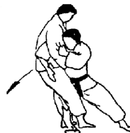
KO UCHI MAKIKOMI (piccolo avvolgimento interno)