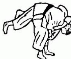
KOSHI GURUMA (ruota sull'anca)