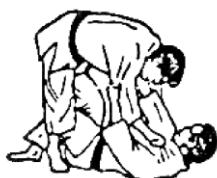
TOMOE NAGE (proiezione a cerchio)