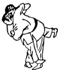
SASAE TSURIKOMI ASHI

(trattenere il piede tirando e sollevando)