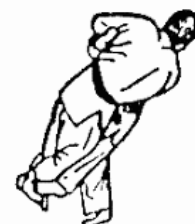
OKURI ASHI BARAI