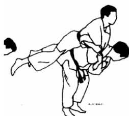
IPPON SEOI NAGE