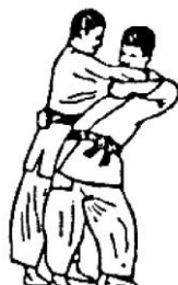
TSURI GOSHI (colpo d'anca sollevando)