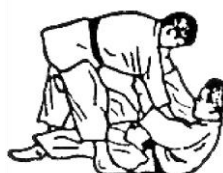
SUMI GAESHI (rovesciamento nell'angolo)