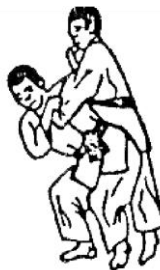
SODE TSURIKOMI GOSHI (colpo d'anca tirando e sollevando)