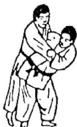
UKI GOSHI (colpo d'anca fluttuante)