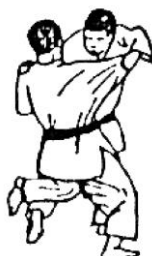
O UCHI GARI