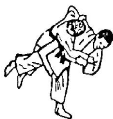
HARAI GOSHI (spazzare con l'anca)