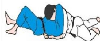
KUZURE KAMI SHIO GATAME