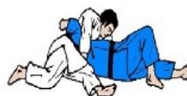
USHIRO KESA GATAME