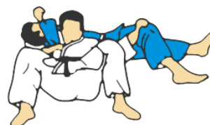
URA SHIO GATAME