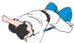
TATE SHIO GATAME