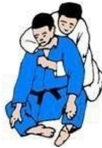
OKURI HERI JIME