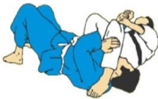
UDE ISHIJI JUJI GATAME