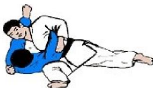
KUZURE KESA GATAME