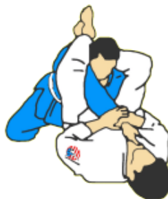
UDE ISHIJI SANKAKU GATAME