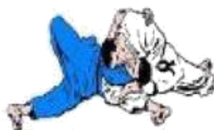
MAKURA KESA GATAME