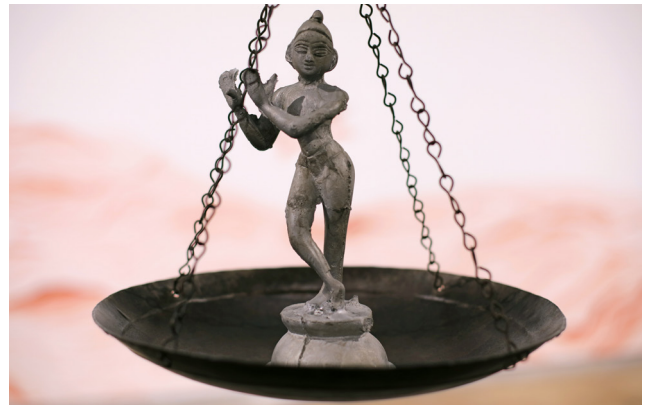
Equanimity (detail), 2017 Francesco Clemente: Watchtowers, Keys, Threads, Gates at Dallas Contemporary

Mit Watchtowers, Gates and The Sea of Stories präsentiert Blain|Southern Berlin die erste europäische Einzelausstellung mit Skulpturen Francesco Clementes (geb. 1952, Neapel). Gezeigt werden The Sea of Stories , eine monumentale, ortsspezifische Wandarbeit, die die komplette Länge des unteren Galerieraumes einnimmt sowie Skulpturen aus den zwei Werkgruppen Watchtowers und Wall of Gates , die von Clemente in Zusammenarbeit mit traditionell arbeitenden Kunsthandwerkern in Rajasthan erschaffen wurden.