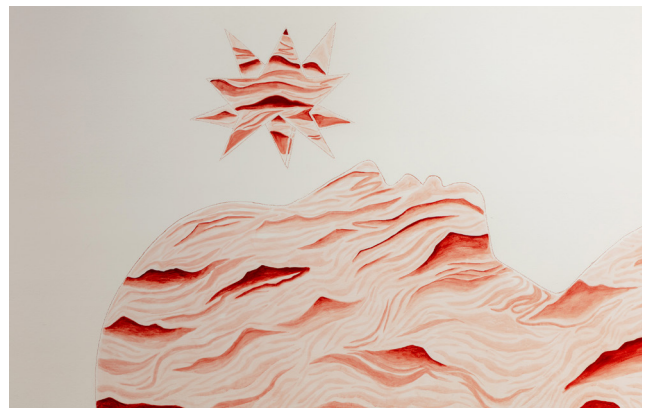
The Sea of Stories (detail), 2019

Francesco Clementes Werk wurde vielfach international ausgestellt, unter anderem in der Whitechapel Art Gallery, London, UK (1983); der Nationalgalerie, Berlin, DE (1984); dem Metropolitan Museum of Art, New York, US (1985); dem Art Institute of Chicago, US (1987) und dem Dia Center for the Arts, New York, US (1988). In den 1990er Jahren wurden seine Arbeiten im Philadelphia Museum of Art, US (1990); der Royal Academy of the Arts, London, UK (1990); dem Centre Pompidou, Paris, FR (1994) und dem Sezon Museum, Tokyo, JP (1994) gezeigt. Das Solomon R. Guggenheim Museum in New York und das Guggenheim Bilbao organisierten 1999/2000 eine große Retrospektiv-Schau des Werkes von Clemente.