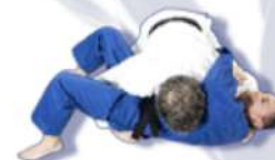
«LA CROIX» Yoko-shiho-gatame