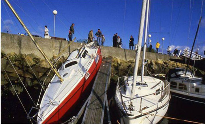
Le port de plaisance de Cherbourg le 16/10/1987 au matin.

À 1h45, les anémomètres encore en état de fonctionner enregistrent 220 km/h à Granville, 197 km/h à Carteret (Ouest France octobre 1987).