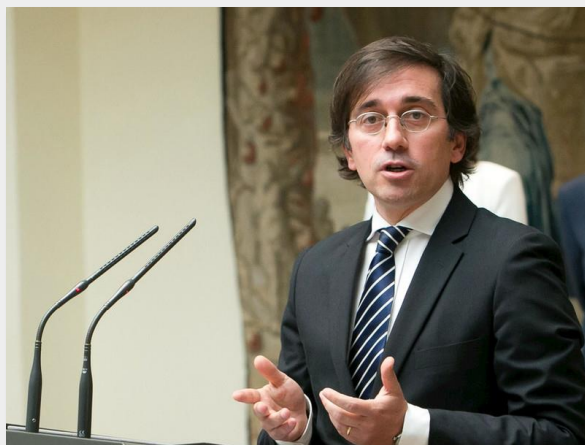
José Manuel Albares Bueno