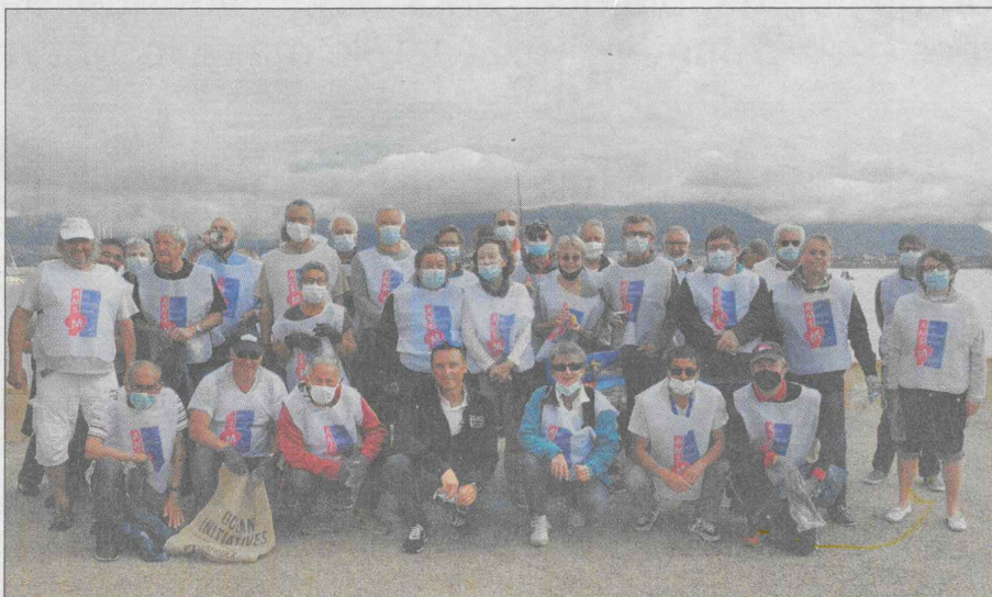
Les nombreux bénévoles ont consacré une matinée au nettoyage des plages.

Hier, ils étaient une quarantaine d'adhérents équipés de chasubles, gants et masques, déterminés à faire plage propre et libérer les