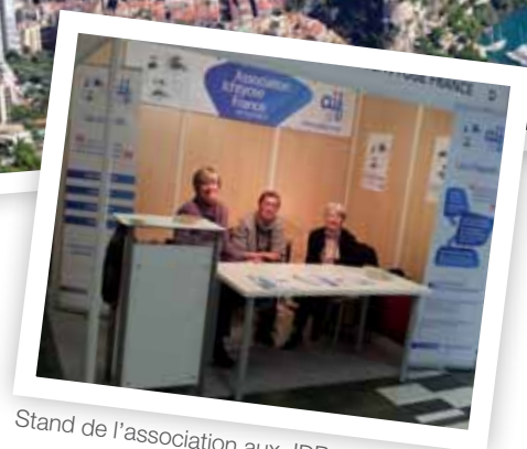
Stand de l'association aux JDP