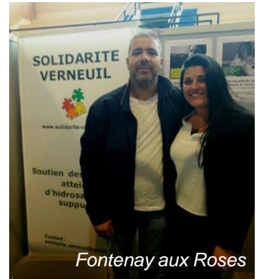
Fontenay aux Roses

Comme toujours, la maladie intrigue plus qu'elle n'inquiète et on s'aperçoit année après année qu'elle est toujours autant méconnue du grand public !