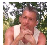
Pascal en Franche-Comté