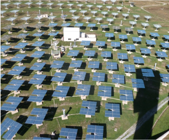
Photo 4. Vue du champ d'héliostats de Thémis. Nous sommes ici à 80 m au dessus du sol. C'est à ce niveau, celui du récepteur central, que se mettent en place les expérimentations du programme PEGASE. L'ombre de la tour est visible sur la photo. Ici les héliostats sont en position de repos. Ils sont pilotés par deux programmes informatiques couplés, un programme superviseur central et un programme embarqué dans chaque héliostat.

Aujourd'hui, le site de Thémis ( photo 4 ), propriété du conseil général des Pyrénées orientales, n'est utilisé que pour l'accueil de « jeunes pousses » développant des technologies solaires y compris photovoltaïques et pour un projet de recherche de PROMES sur une tour solaire thermodynamique munie d'un système hybride solaire/gaz. Ce projet, d'acronyme PEGASE (Production of Electricity from Gas and Solar Energy), concerne la mise au point et les tests d'un prototype de centrale solaire à haut rendement de conversion basé sur un cycle hybride à gaz haute température vers une turbine à gaz de 1,6 MW. Un appoint de chaleur par combustion permettra de maintenir les conditions de fonctionnement de la turbine quel que soit l'ensoleillement. En aval de la turbine à gaz, la cogénération, c'est-à-dire l'utilisation de la chaleur résiduelle augmente sensiblement la compétitivité de ce type d'installation.