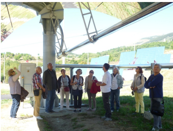
Photo 3. Vue de la centrale à miroirs cylindro-parabolique d'Odeillo. Cette unité d'expérimentation est ici en position de repos. En dessous du miroir de 5,70 m d'ouverture, nous distinguons le tube dans lequel circule le fluide caloporteur. Ce dernier est localisé au foyer de la parabole.

Les centrales à miroirs cylindro-paraboliques est la technologie la plus répandue aujourd'hui. Dans l'axe du foyer de la parabole se trouve le tube collecteur dans lequel circule un fluide caloporteur, qui se réchauffe jusqu'à une température supérieure à 300°C. Le fluide est ensuite transporté jusqu'à un système de génération électrique. L'ensemble miroir cylindro-parabolique/récepteur suit le mouvement du soleil ( photo 3 ). Un stockage thermique permet de produire de l'électricité plusieurs heures après la tombée de la nuit. En Andalousie, la plus grande centrale de ce type d'Europe est, avec la mise en service de sa troisième tranche, sur le point de produire 150 Mégawatts. Des réalisations qui pourront atteindre 600 Mégawatts en 2030 sont en projet.