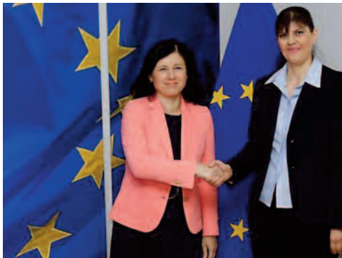
Investiture de Laura Codruța Kövesi (à droite) à la tête du nouveau Parquet européen. Et Vera Jourova, commissaire européenne à la Justice (à gauche).

Mi-septembre, alors que sa future nomination prenait forme avec le vote en sa faveur du Comité des représentants permanents (COREPER), «LCK» s'était voulue politique en expliquant