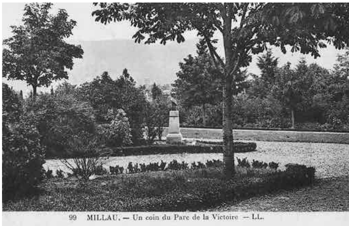
99 MILLAU, — Un coin du Parc de la Victoire — LL.