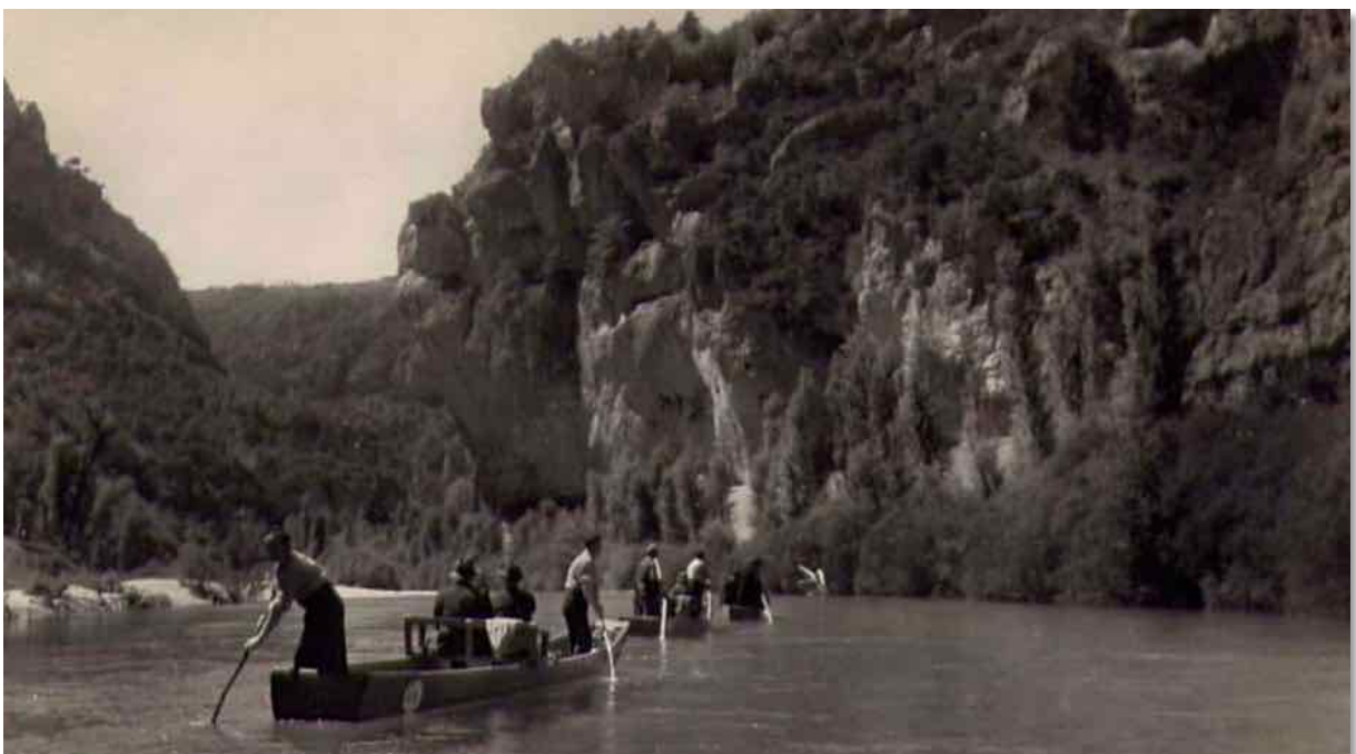
Dans les environs de La Malène, les Baumes Hautes

Bien plus tard, en 1944, nous allions camper en famille aux Vignes. Arrivés sur place, des maquisards faisaient la fête. Mon père pressentait qu'il allait se passer quelque chose de grave avec les Allemands. Alors, il a préféré nous amener vers La Malène, aux Baumes. Nous avons tous dormi dans une grotte ! »