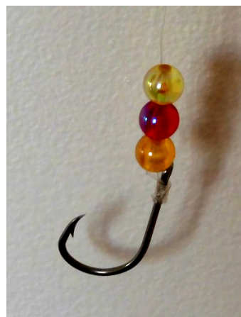
Détail hameçon et sequins