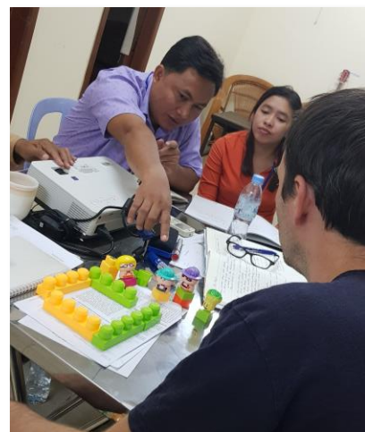
Formation sur l'utilisation des jouets quand l'enfant traumatisé n'arrive plus à prendre la parole.

Les questionnaires d'évaluation de formation des participants nous ont indiqué quelques axes d'amélioration et les supports à retenir pour ce type de formation. Mais plus important que tout – la formation donne des moyens à l'équipe sur place d'aider les enfants à retrouver leur enfance et à se construire de la résilience pour leur avenir.