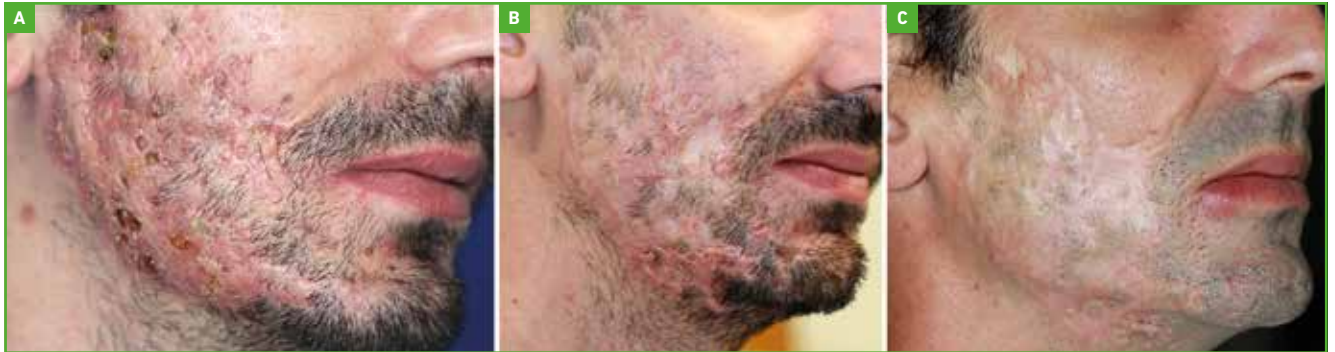
Fig. 4A : Acné conglobata avant traitement ; B : après infliximab ; C : après laser CO 2 .

particulière en raison du surrisque de maladies inflammatoires du tube digestif chez les patients atteints d'HS et qui sont aggravées par les anti-IL17 (maladie de Crohn, données poolées OR : 2,12 ; IC 95 % : 1,46-3,08 ; rectocolite hémorragique OR : 1,51, IC 95 % : 1,25-1,82) [14]. Le guselkumab a montré une efficacité dans une série rétrospective [15] et fait l'objet d'un essai de phase III qui est actuellement en cours ainsi que les inhibiteurs du complément C5a (IFX-1). Un essai randomisé évaluant l'apremilast montre aussi une amélioration significative à 16 semaines sur le score HiSCR [16]. Les anti-IL1 peuvent par ailleurs être discutés dans les formes syndromiques d'HS. Enfin, des données rétrospectives rapportent l'efficacité de la metformine 1,5 g/jour chez des patientes en surpoids [17].