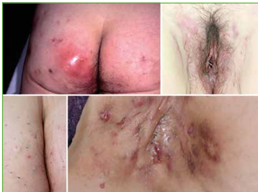
Fig. 1 : Nodules inflammatoires des fesses et de la région génitale, lésions rétentionnelles, fistules et brides cicatricielles.

Les bactéries, en particulier les anaérobies ( Porphyromonas, Prevotella... ), interviendraient dans la progression mais ne seraient pas à l'origine de la maladie qui ne doit pas être considérée comme une authentique maladie infectieuse [3].