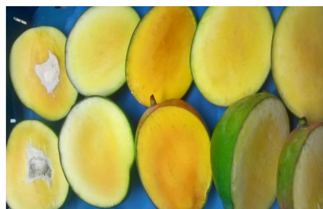
Figuur 1. Onderzoek naar rijpheid van Mango's (DP1)

De aardbei staat centraal in deelproject 3. Twee cultivars uit Spanje en Nederland zijn gedurende het seizoen intensief gevolgd en beoordeelt op kwaliteit. Hieruit worden lessen geleerd hoe kwaliteit zich afhankelijk van de teelt ontwikkelt. Verder worden er uitvoerig experimenten uitgevoerd met verschillende rijpheidstadia van aardbeien op de smaak van de vruchten.