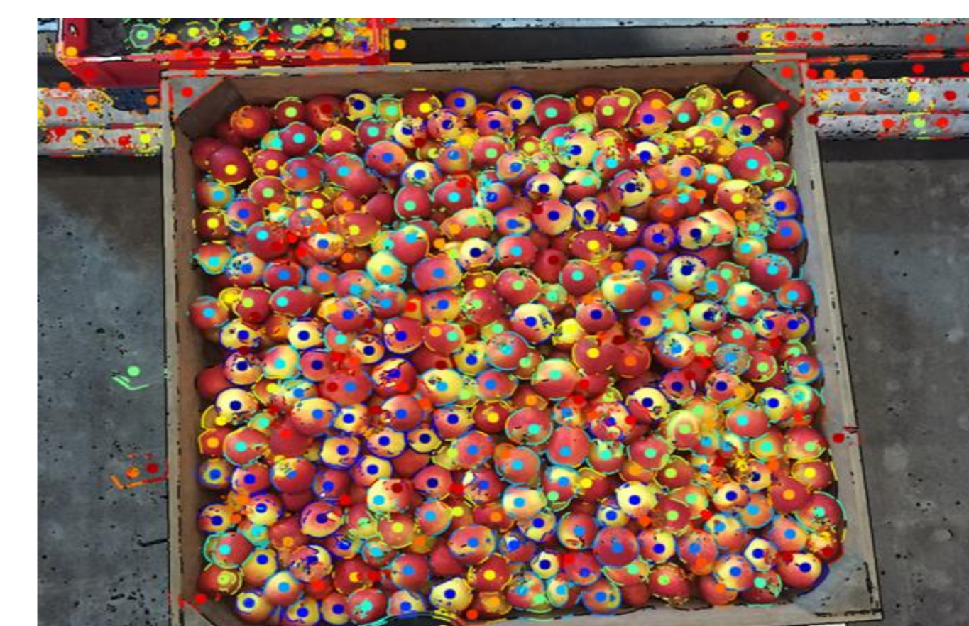
Figuur 3. 2D vision kwaliteitsbepaling van appels in bewaarkist (DP7)

In tegenstelling tot de andere deelprojecten richt deelproject 7 zich niet op een product, maar op techniek: Robot-vision technologie. Het doel is het automatisch niet-destructief meten van kwaliteit. Dit leidt tot een uniformere bepaling van kwaliteit, herhaalbaarheid van metingen, objectivering van metingen, monitoring over tijd en er kunnen potentieel meer samples (of alles) gemeten worden. Per partner resulteert dit in een 'proof of principle'.