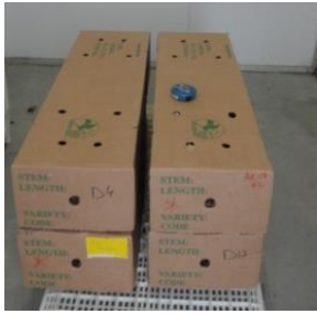
Bewaring van rozen in klimaatcel bij 0.5 °C in transportdozen