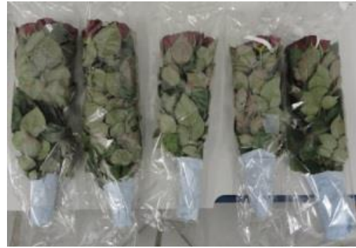
Voorbeeld Grand Prix rozen na bewaring