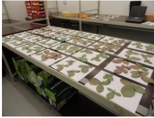
Bladeren drogen uit voor bepaling van de huidmondjesrespons.