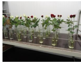
Individuele rozen worden gebruikt voor de bepaling van de waterbalans. De rozen staan hier op water (wit), en op water met bactericide (geel).