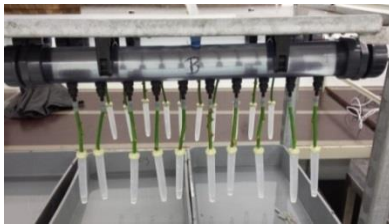
Opstelling voor het meten de doorstroomcapaciteit van stukjes stengels na bewaring. Water wordt met gelijke druk door stengels gedrukt en opgevangen. Het opgevangen volume water wordt in de tijd gemeten.