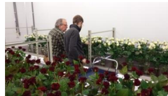
Uitbloeioproeven en beoordeling voor bepaling vaasleven