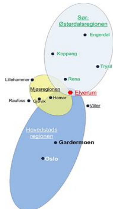
Figur 1: Elverums rolle i Innlandet

Les mer om disse tre rollene i kommuneplanen «Elverum mot 2030» .