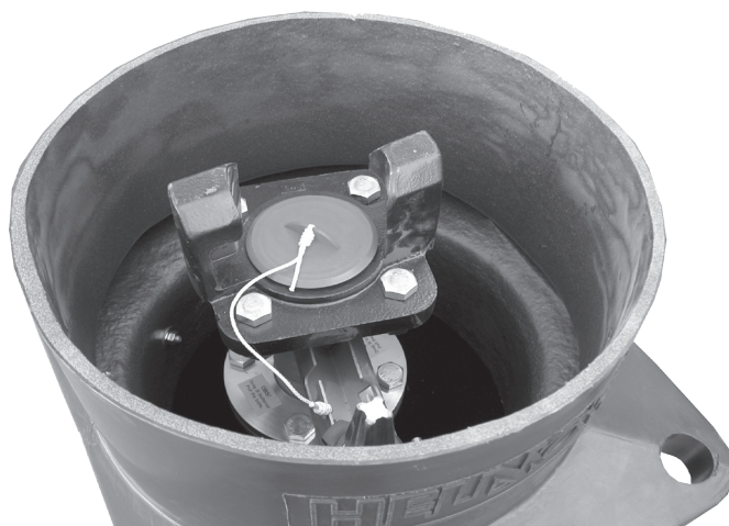
Komplett brannpostbrønn sett ovenfra

Rett til endringer uten varsel. Alle rettigheter følge norsk lov 16.06.72 -no 47 par. 1,7,8,9