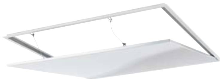
Leveres med sikkerhets-wire.

HELNOR AS For siste oppdaterte versjon Postboks 74 av dette databladet, 2361 Rudshøgda se www.helnor.no