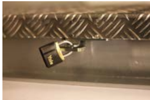
Låseanordning for hengelås er standard.