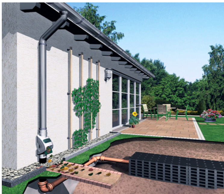
En pakke består av flere kassetter koblet sammen.