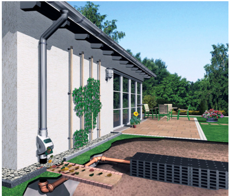
En pakke består av flere kassetter koblet sammen.