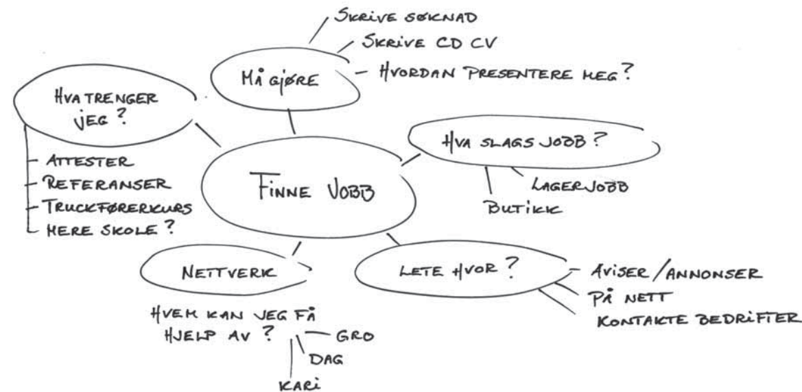
Eksempel på et tankekart hvor utgangspunktet er "finne jobb".

Tankekart (eller mind map) er en nedtegning av tanker og ideer og brukes for å få oversikt og sette ting i sammenheng. Metoden går ut på å skrive et ord/begrep (problemstillingen) i midten av et ark, for deretter skrive ned tanker som dukker opp i tilknytning til problemstillingen. Ta gjerne utgangspunkt i områder adepten kan ha behov for veiledning i forhold til. Et tankekart kan være med på å klargjøre adeptens utfordringer. Hvilke muligheter og hindringer adepten står overfor vil komme tydeligere frem, og da er det lettere å velge ut hva dere skal jobbe videre med, og på hvilken måte. Ofte er det lettere å se hva som trengs når man har kartet foran seg.