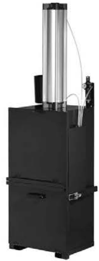
Buggy 10 Art.no. 000841