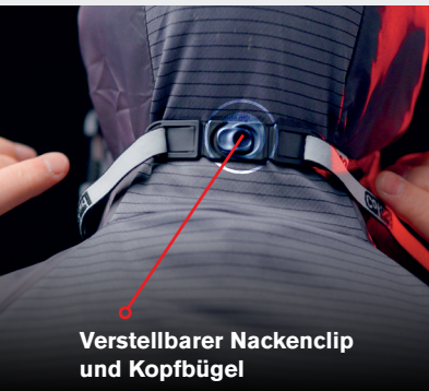
Verstellbarer Nackenclip und Kopfbügel

Zum Schutz vor schädlichen Dämpfen und Partikeln!