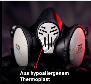
Aus hypoallergenem Thermoplast