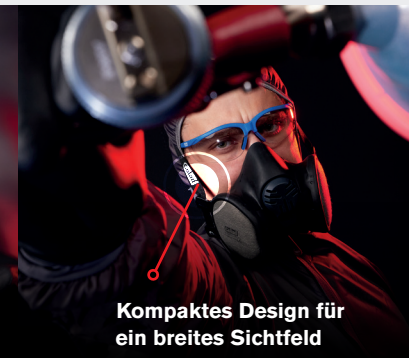
Kompaktes Design für ein breites Sichtfeld