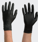
Einweg Nitril Handschuhe Schwarz