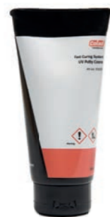
UV Szpachlówka Wypełniająca