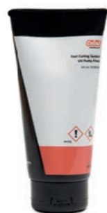
UV Szpachlówka Fine

190 g. tube Do wypełniania niewielkich pęknięć, wgnieceń i odprysków od kamieni