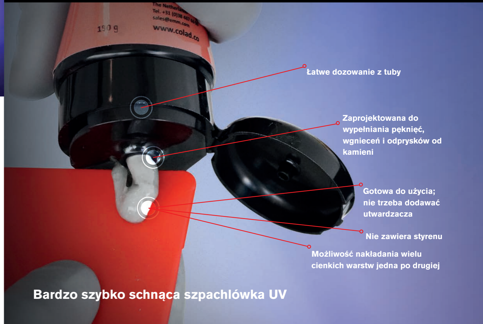
Bardzo szybko schnąca szpachlówka UV