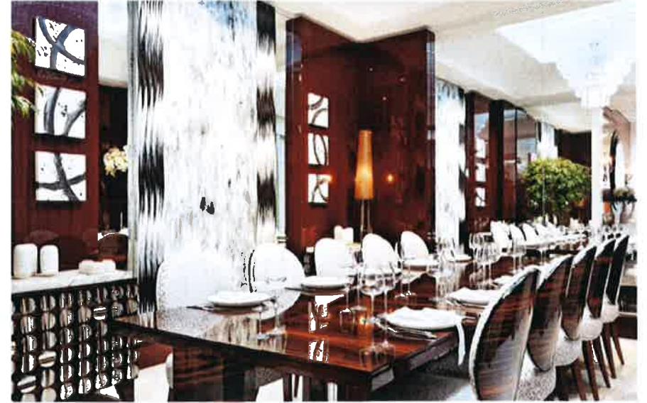
"غاليري سولاندز" Gallery Sollands - ربيع/أصيف 2019

إلى نقل من الكمال في جوهر كل قطعة مفهوم فريد وفكرة فريدة ترتقي بها فوق الوظيفة لترسخها في القرن الحادي والعشرين. الوحدات التمثالية التي تتذكرها "غراجينا" مكمسة وسلاسة على كل جوانبها بظلمات من أخشاب ثنوات الأشجار. وملبسة بأحجار شبه كريمة أو الفضة الأسترالية. التي جرى فصها بدقة وحفرها وتسجيلها مع بصمة GRA الرسمية لفحص المواد وتقدير نقاوتها. مجموعة الكرسي الأنيقة التي صممها بظهور دائرية أو إهليجية نظيفة تبدو كأنها تطفو عائمة حرة فوق مقاعدها. وقد جرى تنجيدها بجلود فاخرة. تحمل الكثير منها تطريزات فريدة من إبداع "هم المنظرين في الملكة المتحدة الطانية الملكة الفخمة تزخرف الكثير من ابتكارات "غراجينا" سواء أكان اللؤلؤ لونا واحدا جريتا تتجمع به تفاصيل معدنية زينية أو مزيجا باهرا من الألوان الجذابة التي تبرز شكل القطعة وهيكلها. هذه التصاميم الفنية القوية سهلة التمييز والتحديد كابتكاراتها