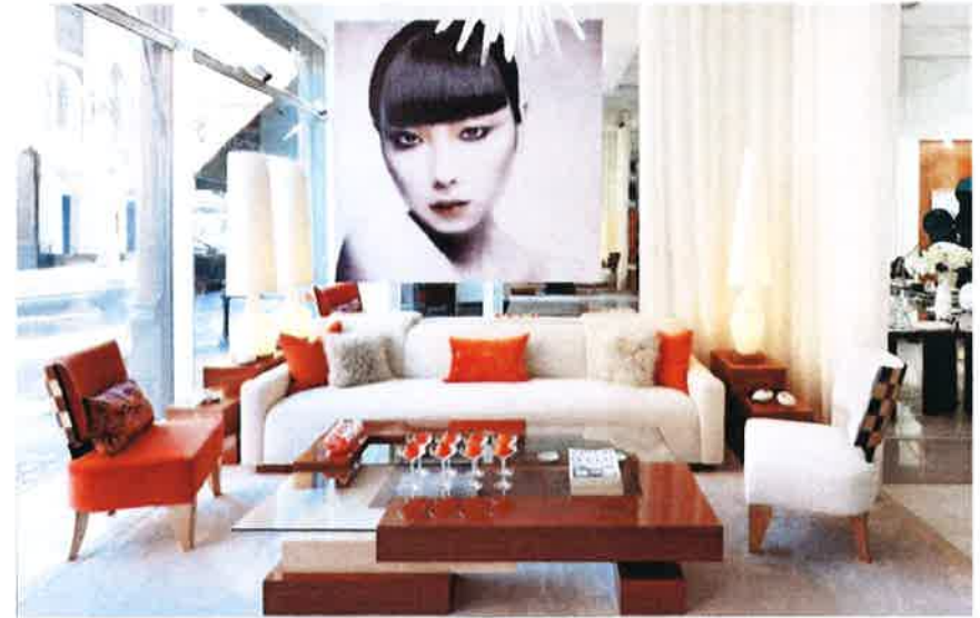
"غاليري سولاندز" Gallery Sollands - ربيع/صيف 2019

غاليري 'سولاندز' Sollands في منطقة ميغيفر في لندن عنوان لتصاميم 'غراجينا سولاند' Grazyna Solland منذ نحو ثلاثة عقود. ويعرض مجموعة مفروشات الفينة Gra Collection of Art التي تتألف من قطع متنوعة رائعة مصنوعة من مواد فاخرة بألوان مذهشة تبرزت 'غراجينا'. وما فيها شغف بالفن. فأرابت عيش حياتها في هذا المجال. غير أن والدتها العلية التفكير أصرت على أن تدرس أولا وتتخصص في مجال يضمن مستقبلها بشكل أفضل. بعد