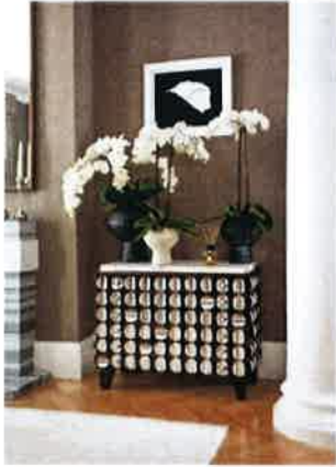
Diak Cabinet خزانة مزينة بدوائر معدنية

الحرفي والمهارة المبدعة. تعمق بطل عصر ماض من الفخامة والترف الذين لا يساوهم والنادري الوجود في أيامنا مع خلقية الهندسة المعمارية في حوزتها تجرت "غراجينا" عدد من مشاريع الترميم لعقارات سكنية فخمة في مناطق لندنية مختلفة مثل ميغيفر وبيلفرافيا وريجنتس بارك حيث تزيت المساحات بالكثير من قطع مفروشاتها الفنية. مع رطتها الفريدة التي تشمل التصميم الداخلي والعمارة إضافة إلى حسبيتها الفنية القوية. من غير الحاجز أن يكون تحويلها لقر مصرف مساحته 36000 قدم مربعة في ميغيفر. وجعله من جديد قصرا من تصميمها قد أكسبها أعلى ثناء وتقدير من "هيئة الثرات الإنجليزية". ليس فقط لتصميمها بل أيضا للحرفية الإنجليزية المتنازة. "سولاندز" تمتلك صالة عرض ومكاتب في 81 شارع "ساوث اوبلي" بمنطقة "ميغيفر" بالخاصة لندن.