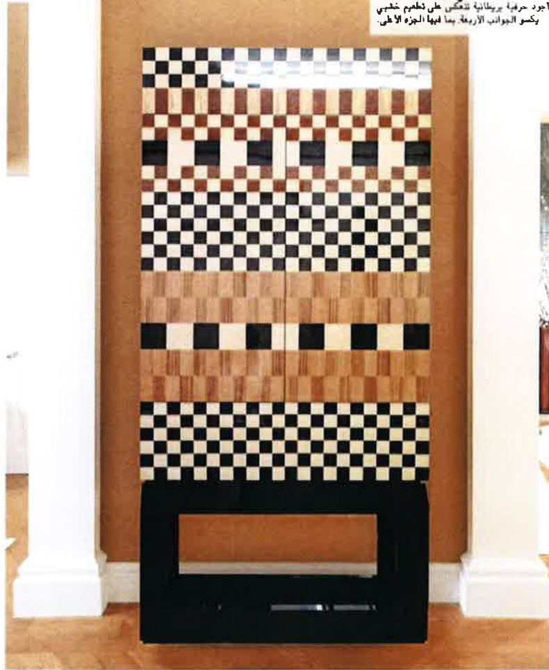
قطعة 'مارك III' Marque III أجود حرفية بريطانية تنعكس على تصميم خشبي يكسو الجوانب الأربعة. بما فيها الجزء الأعلى.