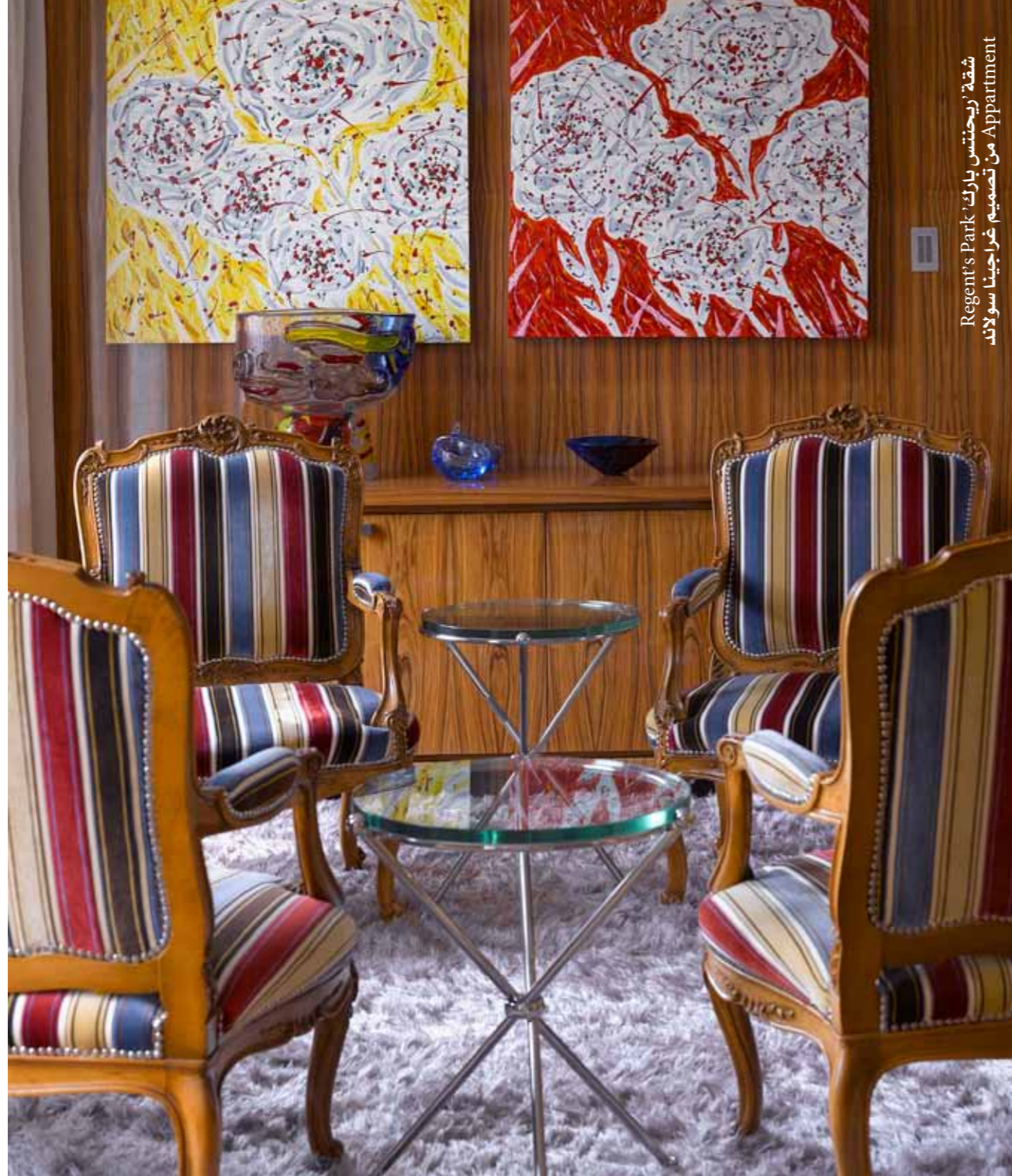
شقة 'ريجننتس بارك' Regent's Park من تصميم غراجينا سولاند Apartment

التصميم الكلاسيكي والتصميم المعاصر. إذا اطلعنا على صور لصالحة عرضي قبل 28 عاماً حين كنت أعمل مع شركات وأكيف تصاميمهم لتناسب متطلباتي، ونقارنها بالمفروشات الفنية التي أصممها الآن وأنتجها في مشغلي، نرى تطوراً تاماً: من وجود عناصر مبدعة إلى قطع فنية. أبقى خارج التيار والصيحات بدلاً من اتباعها.