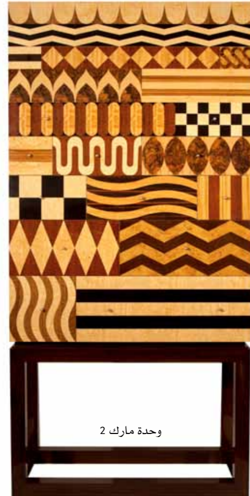
وحدة مارك 2

ما هو أغرب مشروع طلب منك العمل عليه؟ آسفة، لكن لا طلبات غريبة حتى الآن. ربما في المستقبل. ما هي الصيحات التالية برأيك؟ وماذا عن الألوان التي ستكون رائجة؟ بما أنني لا أتابع التيارات، أو على الأقل ليس بوعي، لست مؤهلة للإجابة على هذا السؤال. لكن يمكنني مع ذلك أن أعبر عن سروري برؤية المزيد من الألوان والنقوش التي تعود إلى هندسة الديكور عمومًا، لأنني أجد الديكورات البيجية