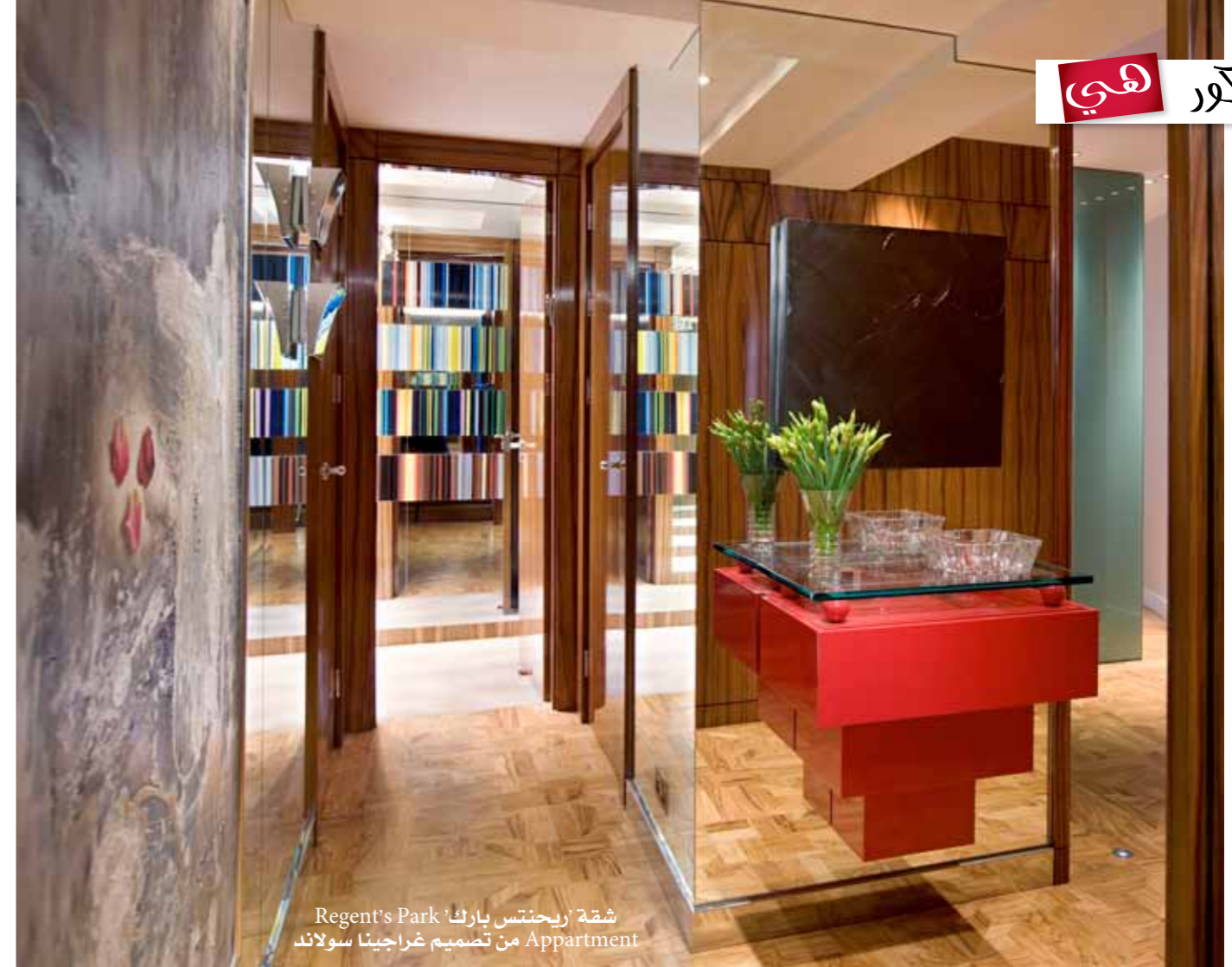
شقة 'ريجننتس بارك' Regent's Park من تصميم غراجينا سولاند Apartment