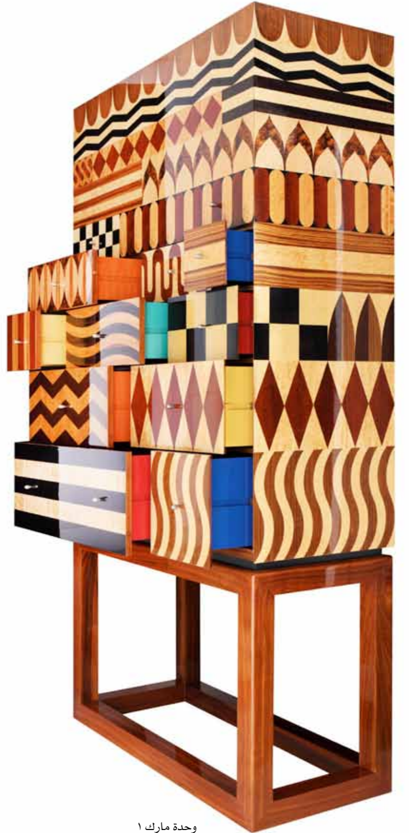
وحدة مارك 1

من قطعي المفضلة لدي وحدتي "مارك 1" و"مارك 2". أحب مقياس الوحدات فيهما، والتطعيم المعقد المقصود على اليد