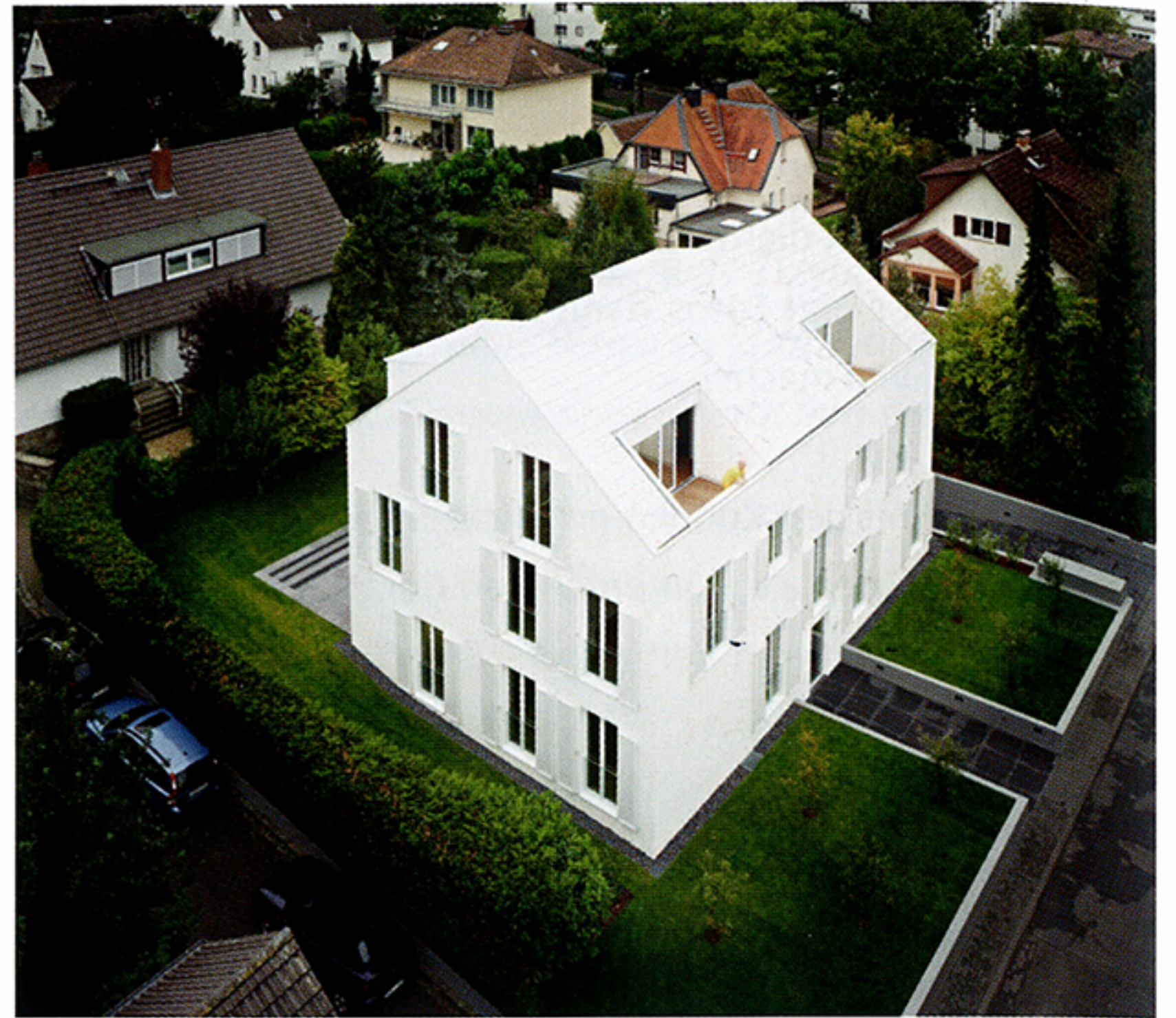
Wohnhaus am Heiligenstock