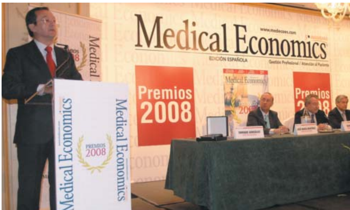
El Director del Instituto Roche agradeciendo el premio recibido

Pública), Asisa (Aseguradora Servicios Sanitarios), Lilly (Información a pacientes realizada por una entidad), el Ministerio de Sanidad y Consumo (Campaña de Información a Pacientes), la Fundación Española para la Diabetes (Información a Pacientes realizada por una asociación), la Sociedad Española de Oncología Médica (Sociedad Científica), la Fundación