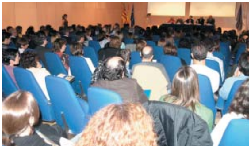
Aforo completo en el auditorio del Centro de Investigación Príncipe Felipe