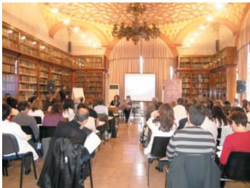
Vista de la Biblioteca Cambó, lugar donde se celebró la jornada