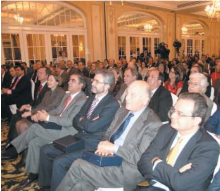
Vista general de la sala donde se realizó la entrega de premios

Instituto Roche (Fomento e Investigación en Salud y Medicina), la Confederación Española de Sindicatos Médicos (Sindicato Sanitario), el Grupo Hospital de Madrid (Grupo Hospitalario), la Consejería de Sanidad de Castilla-La Mancha (Consejería Sanitaria con mejor actividad) y la Asociación Española de Derecho Sanitario (Premio Medical Economics V Aniversario).