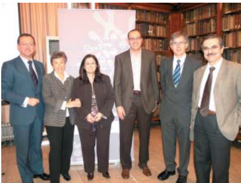
Los ponente que participaron a lo largo de la jornada

En el ámbito de la Psiquiatría también se han ido acumulando en los últimos años numerosas eviden-