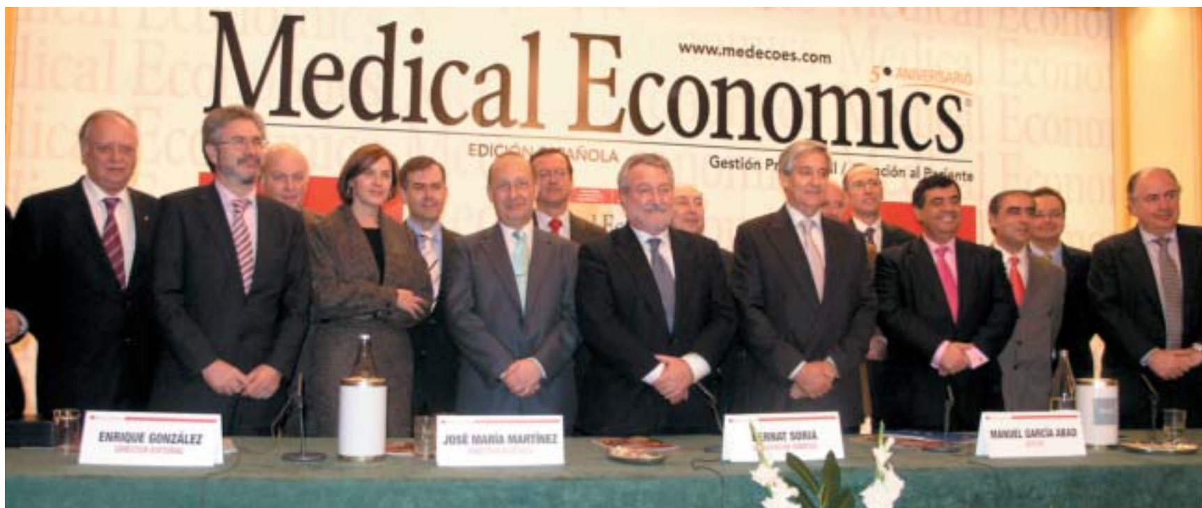
Foto de familia de los galardonados y organizadores junto al Ministro de Sanidad y Consumo