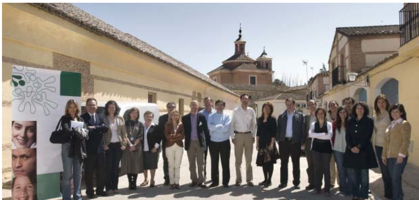
Los ponentes y periodistas participantes en el seminario, en las calles de Aranjuez