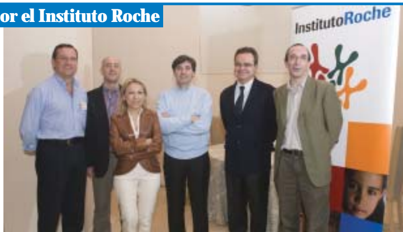
Los ponentes de una de las mesas redondas del seminario

Con el objetivo de revisar los conocimientos sobre los avances y retos que se están planteando en el ámbito de la Medicina Individualizada, el Instituto Roche celebró el pasado 4 y 5 de abril en Aranjuez (Madrid) un seminario titulado "Genética, Genómica y Medicina Individualizada". Con esta iniciativa se ha pretendido poner en contacto a investigadores básicos y clínicos de primer nivel, que están liderando estos progresos, con periodistas de referencia, con la intención de facilitar el traslado de esta valiosa información a los profesionales sanitarios y a la población general.