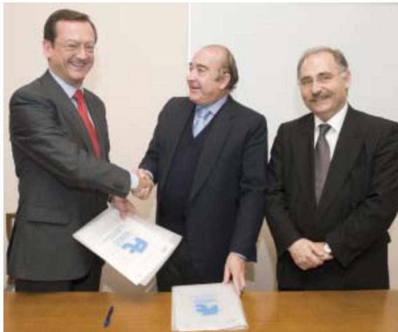
Momentos después de la firma del convenio marco de colaboración