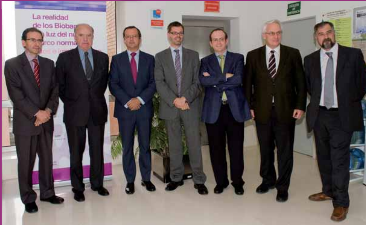
El Director General del Instituto Roche, junto con algunos de los ponentes participantes en la jornada

Según se puso de relieve en una reunión organizada por el Banco Nacional de ADN, el Instituto Roche y el Centro de Investigación del Cáncer de Salamanca (CIC)