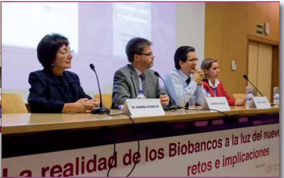
Al final de las presentaciones, se mantuvo un dinámico debate entre ponentes y asistentes

desarrollo e integración de nuevas herramientas comunes de análisis masivo de datos, estándares y protocolos, y proporcionar pautas de actuación en cuestiones éticas, legales y sociales.