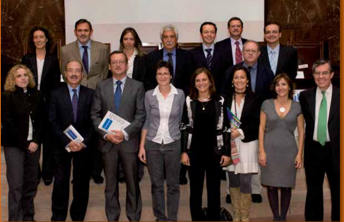
La reunión sirvió para presentar oficialmente el documento sobre “Controles éticos en la actividad biomédica”

sus funciones son en muchos casos complejas y controvertidas, y acusan una crónica falta de recursos y, en algunos casos, de formación específica, lo que en muchas ocasiones les impide llevar a cabo adecuadamente su labor.