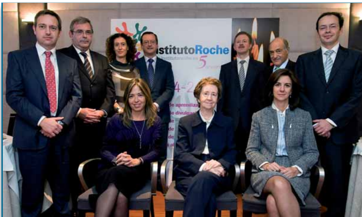
En el acto participaron tanto representantes del Patronato como del Consejo Asesor del Instituto Roche.