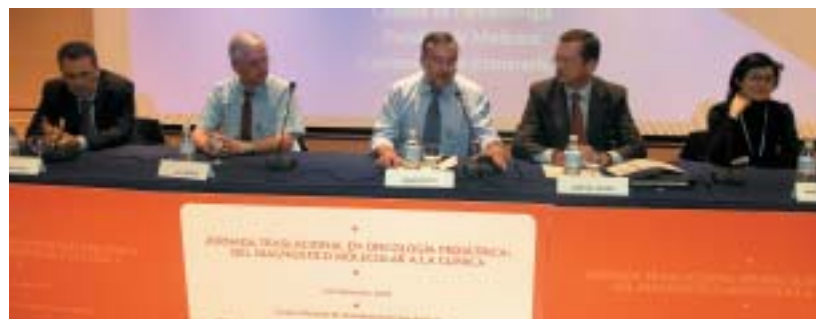
La reunión permitió un análisis exhaustivo de los avances registrados en el diagnóstico y tratamiento de los sarcomas infantiles, las leucemias y los síndromes de inestabilidad cromosómica

leucemia aguda mieloblástica (LMA). Por eso ahora, además de aumentar la supervivencia, también se trabaja intensamente por evitar secuelas y mejorar la calidad de vida del paciente.