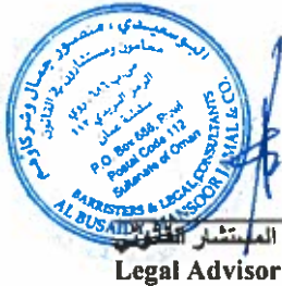
المستشار القانوني Legal Advisor

على من يرغب في الترشيح لعضوية مجلس الإدارة تعبئة إستمارة الترشيح المعدة لذلك والتي يمكن الحصول عليها من مقر الشركة ، وتسليمها للشركة قبل موعد انعقاد الجمعية العامة بيومين على الأقل وذلك في موعد أقصاه الساعة الخامسة مساء يوم الأحد الموافق ١٧/٣/٢٠١٩م ولن تقبل أي إستمارة تقدم بعد ذلك .