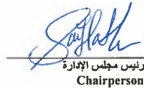
رئيس مجلس الإدارة Chairperson