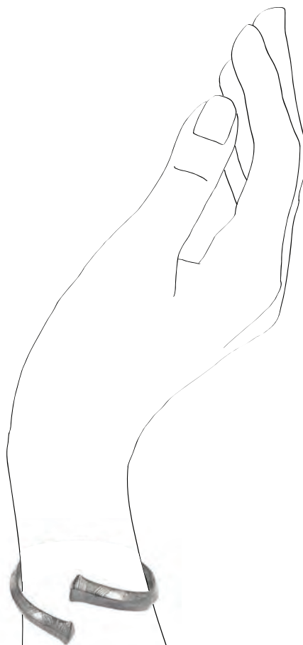
30. Ασημένιο βραχιόλι (ψέλιο), 8 ος αι. π.Χ.