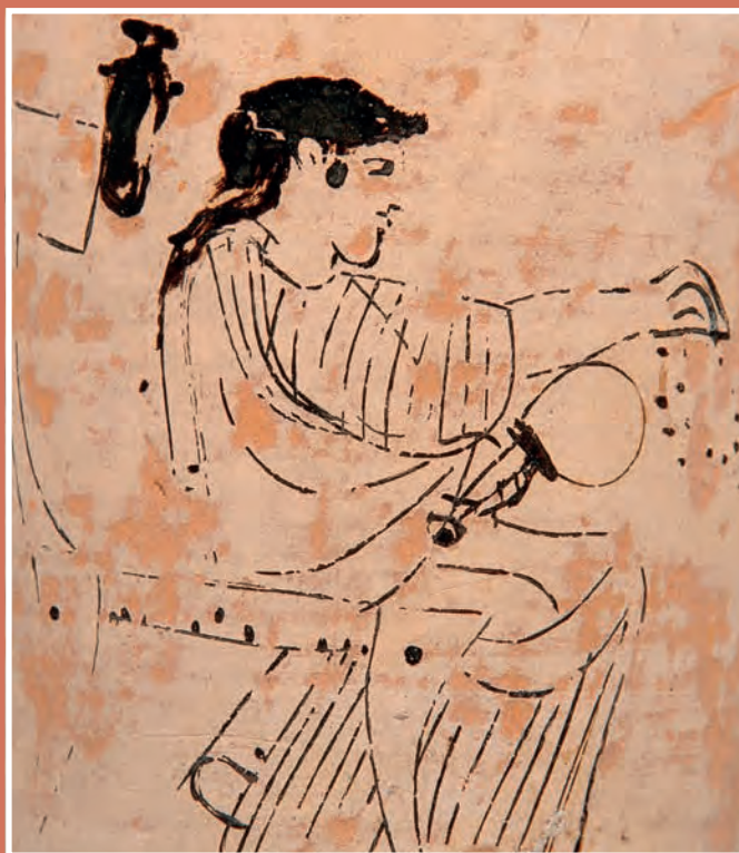
33. Λεπτομέρεια από λήκυθο με λευκό βάθος, περ. 460 π.Χ. Καθιστή γυναίκα κρατάει καθρέφτη και στεφάνι.