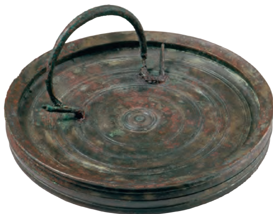
35. Χάλκινος καθρέφτης από την Κύπρο, τέλη 4 ου αι. π.Χ.