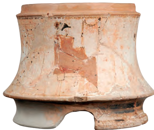
36. Ερυθρόμορφη τριποδική πυξίδα (κοσμηματοθήκη) με λευκό βάθος, 460-450 π.Χ.