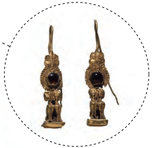
32. Χρυσά ενώτια (σκουλαρίκια), τέλη 3 ου - αρχές 2 ου αι. π.Χ.