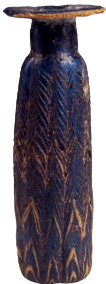
34. Γυάλινο αλάβαστρο (μυροδοχείο), 4 ος αι. π.Χ.

Τα κοσμήματά τους τα φύλαγαν μέσα σε κοσμηματοθήκες, τις λεγόμενες πυξίδες, ενώ τα αρώματά τους σε αρωματοδοχεία. Όπως και σήμερα, οι γυναίκες χρησιμοποιούσαν καλλυντικά, όπως πούδρες, βαφές για τα μαλλιά κ.ά. που ονομάζονταν ψιμύθια. Τέλος, απαραίτητο εξάρτημα καλλωπισμού ήταν και οι χάλκινοι καθρέφτες.